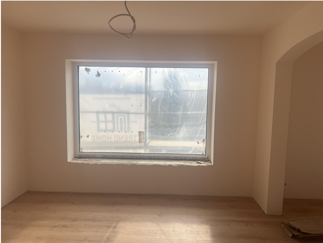
Sitzfenster mit Ausblick