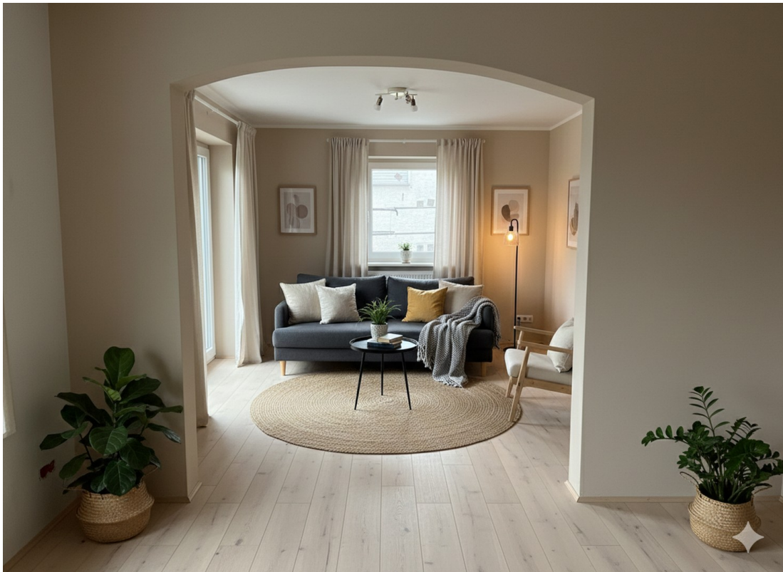
KI-Bild des Wohnzimmers