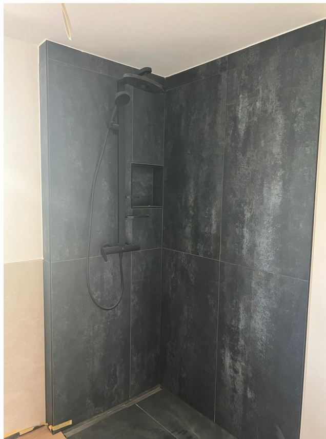
Duschbereich im Badezimmer