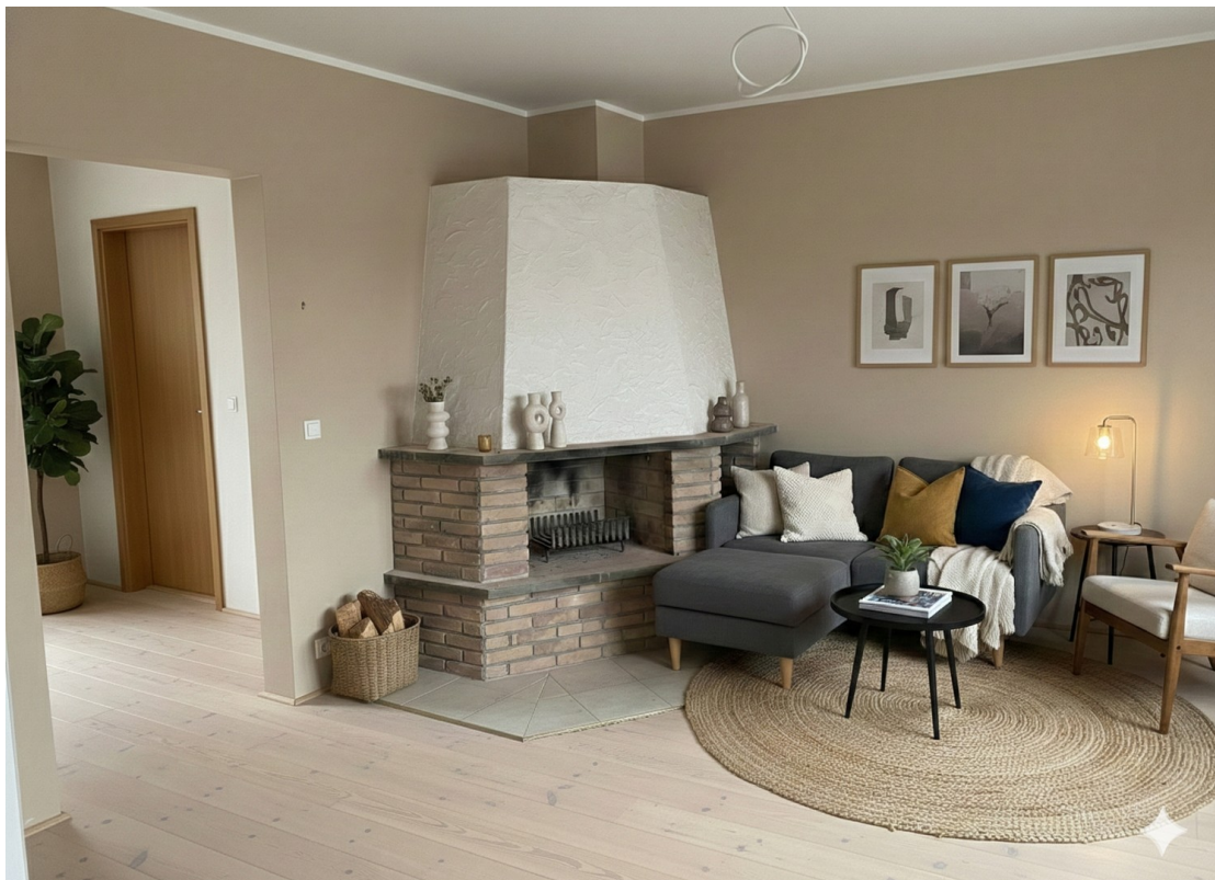
KI-Bild des Kaminzimmers