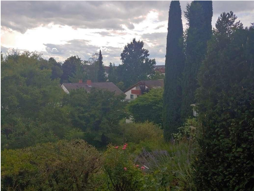
Blick aus dem Fenster