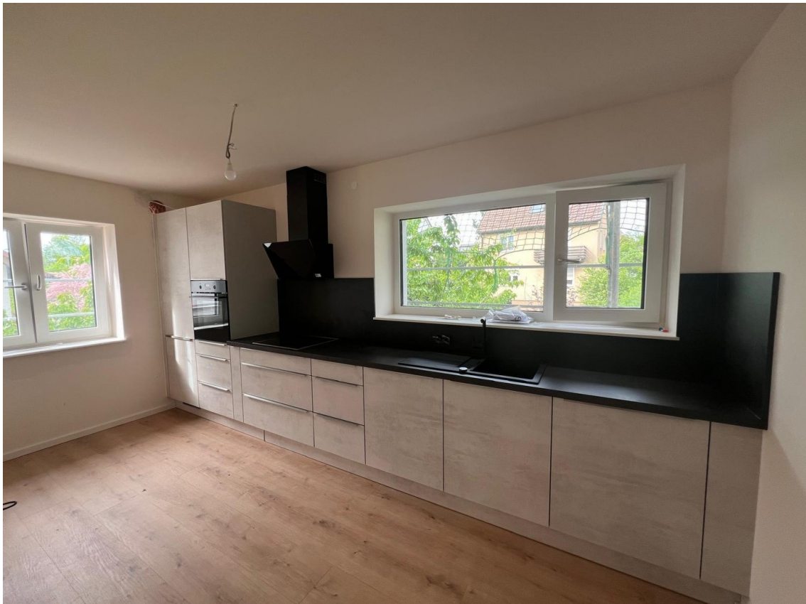
Küche inkl. Einbauküche