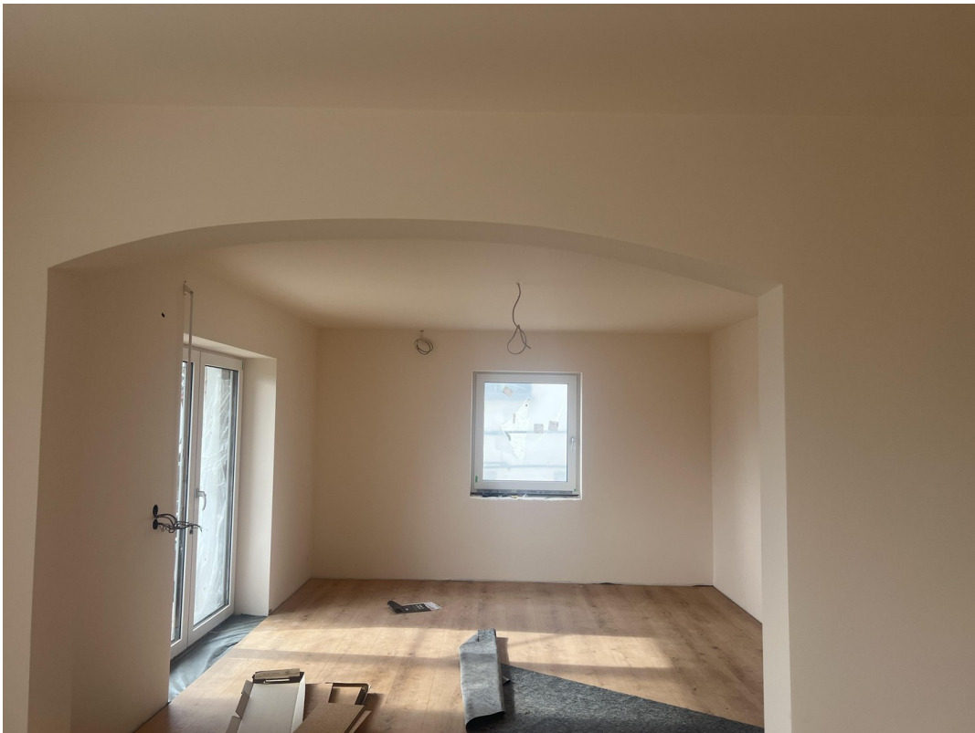
Blick ins Wohnzimmer