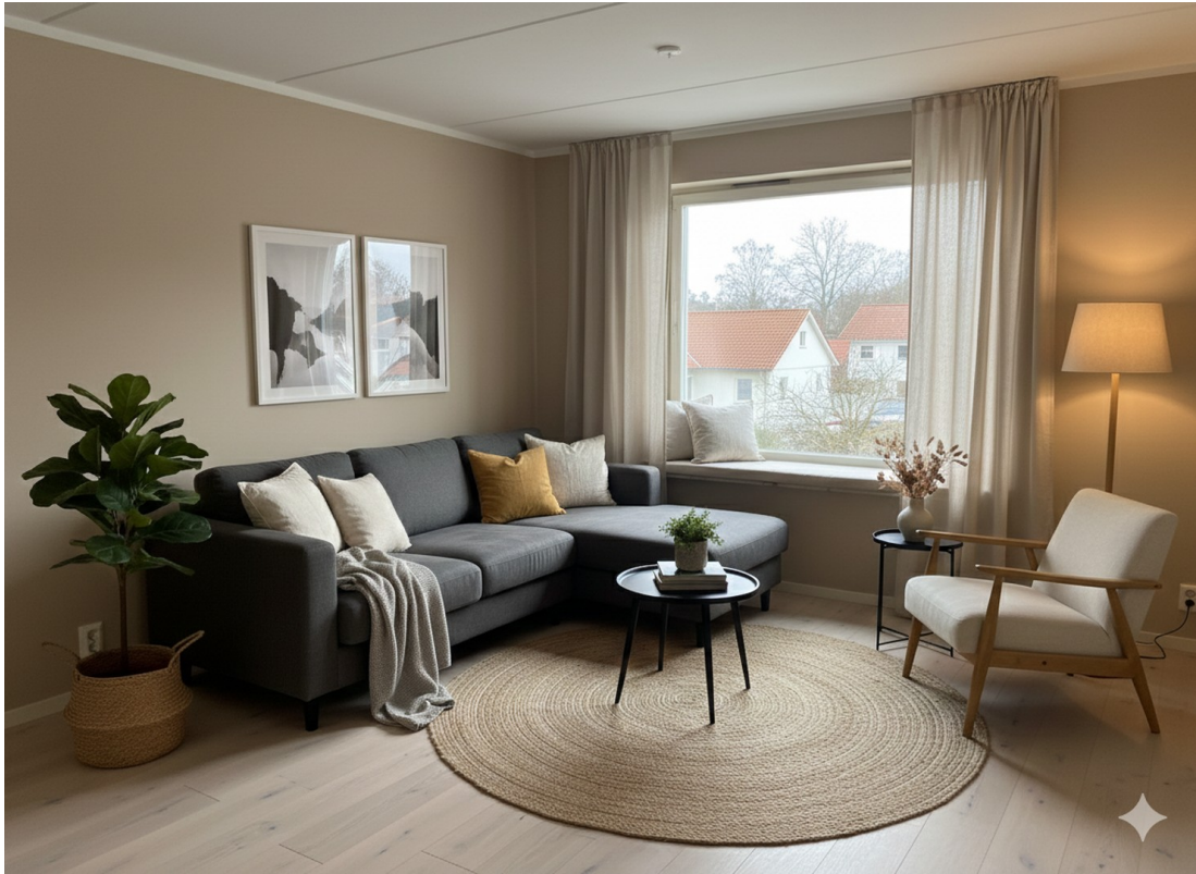
KI-Bild des Kaminzimmers