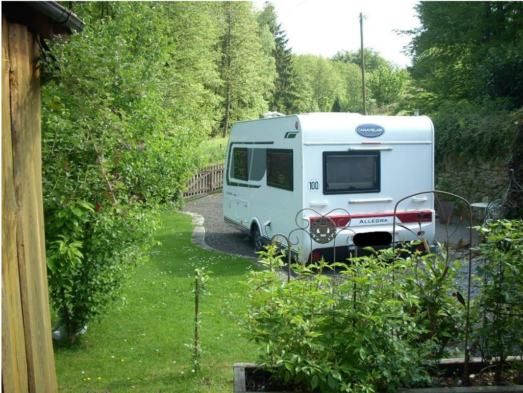
Garten zweite Stellplätze