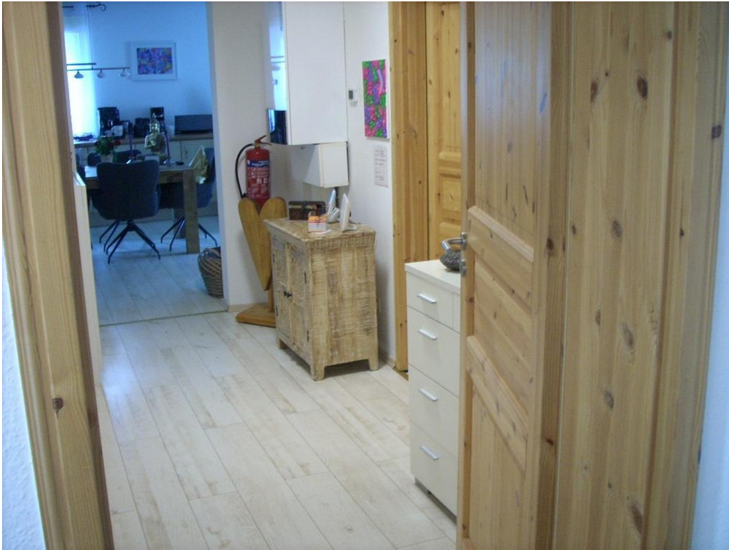
Flur 2 Heiztherme