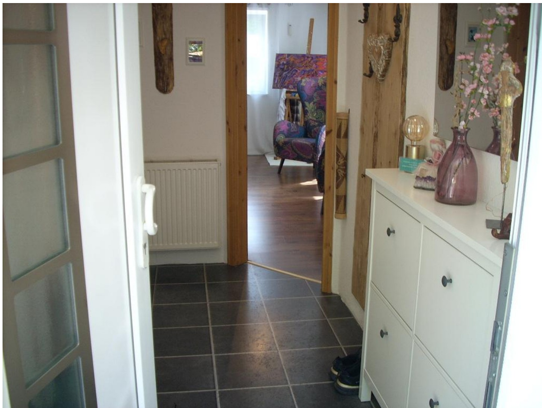
Eingang Flur 1