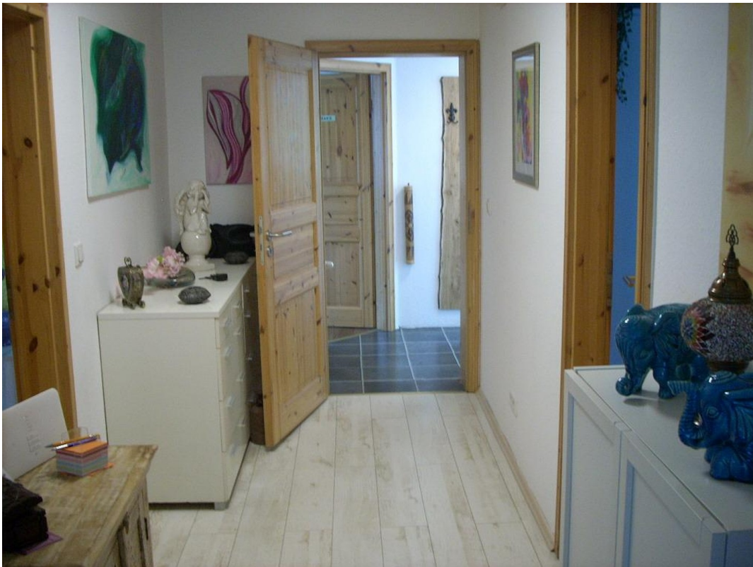
Flur 2 Heiztherme