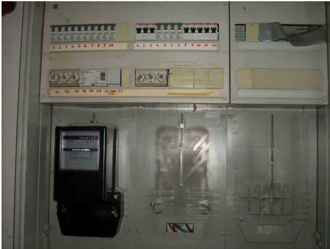
Zählerschrank mit Verteilung