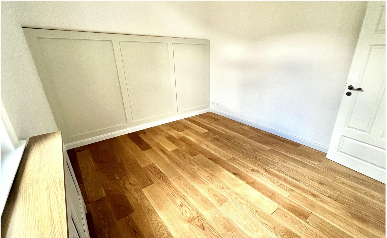
Schlafzimmer mit Eichenparkett