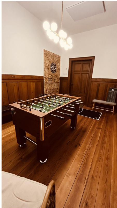
Veranda mit Kicker und Dart