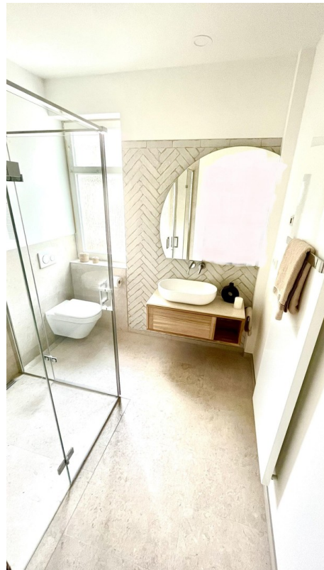
Bad mit Fußbodenheizung