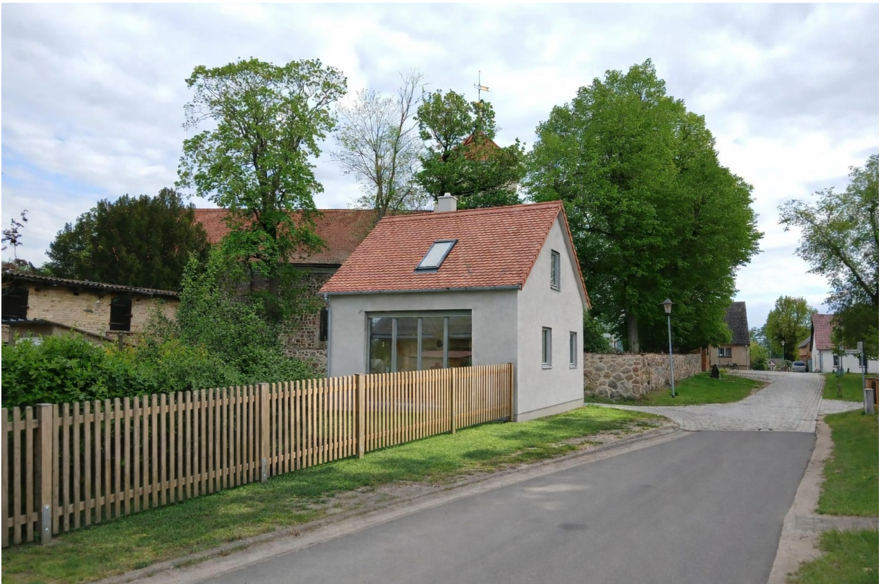
Blick vom Dorfladen