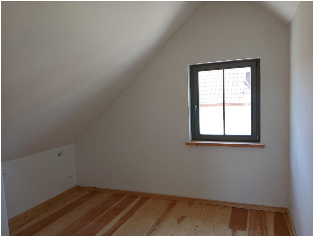
Schlafzimmer 1. Geschoss