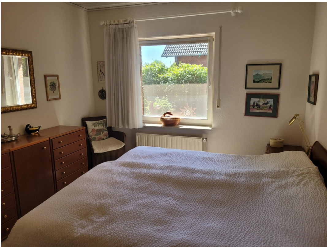
Schlafzimmer mit angrenzender