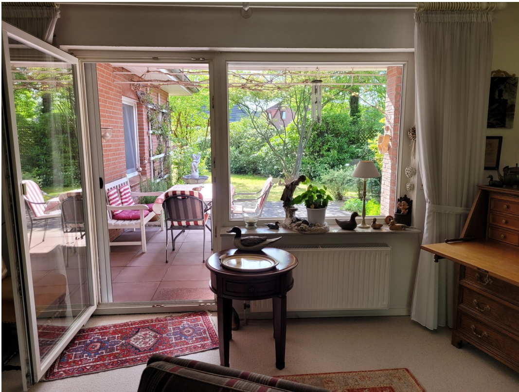
Wohnzimmer mit Zugang zur über