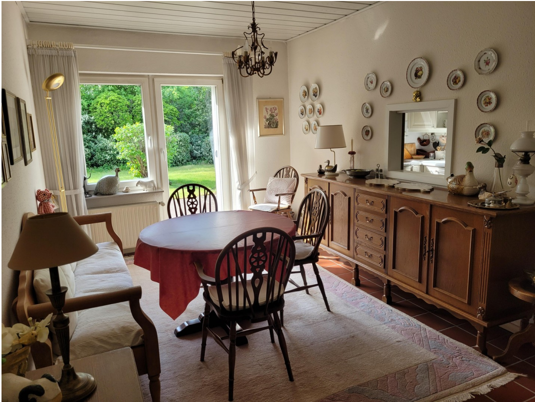
Esszimmer und Durchreiche zur