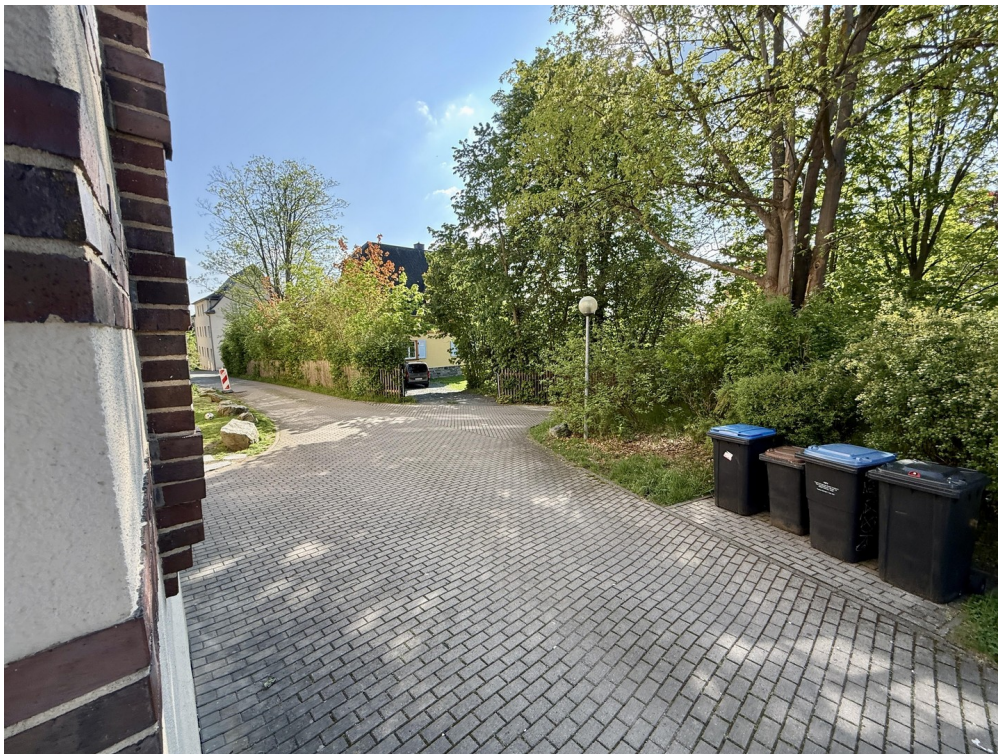
Eingang Blick aus Kinderzimmer