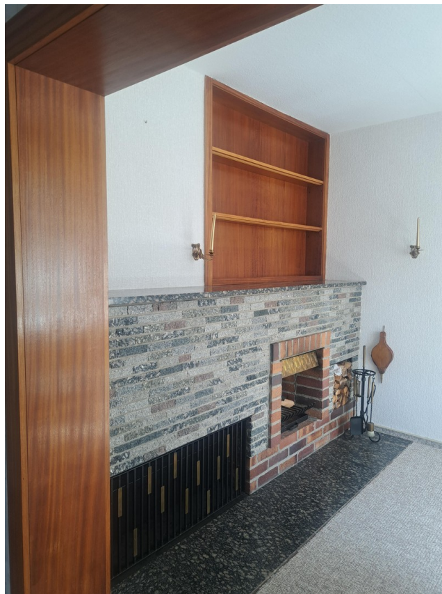
Wohnzimmer Blick auf Kamin