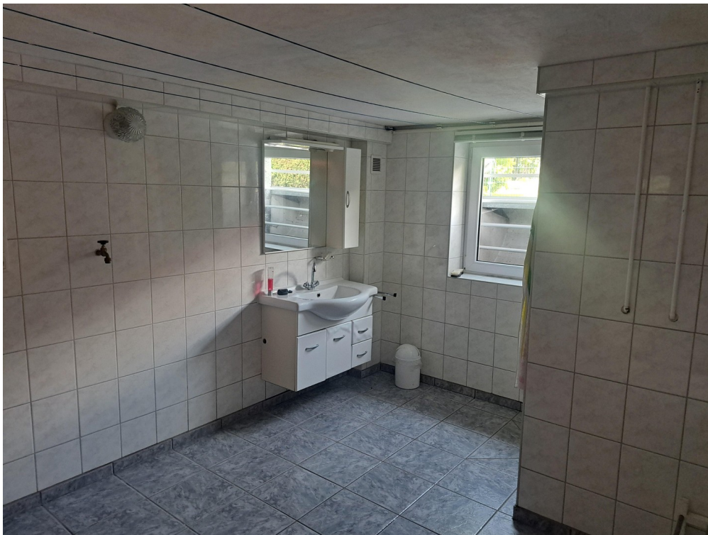
Heizungskeller mit Dusche