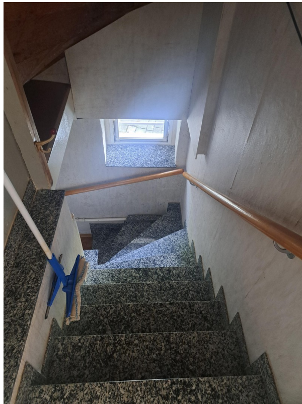
Treppe zum Keller