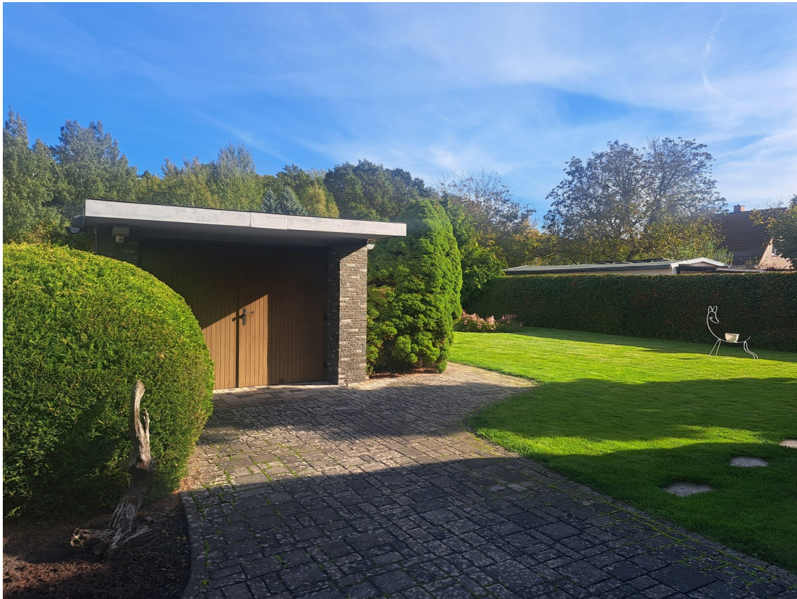
Blick auf Garage und Garten