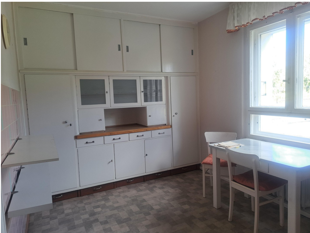
Küche mit Einbauschränk