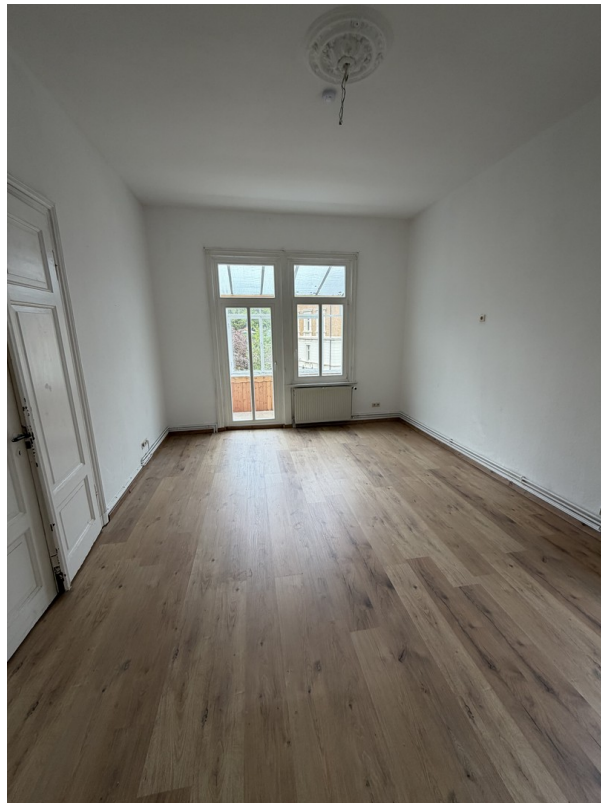
Arbeitszimmer/Esszimmer + Balk