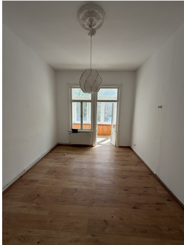
Schlafzimmer + Wintergarten