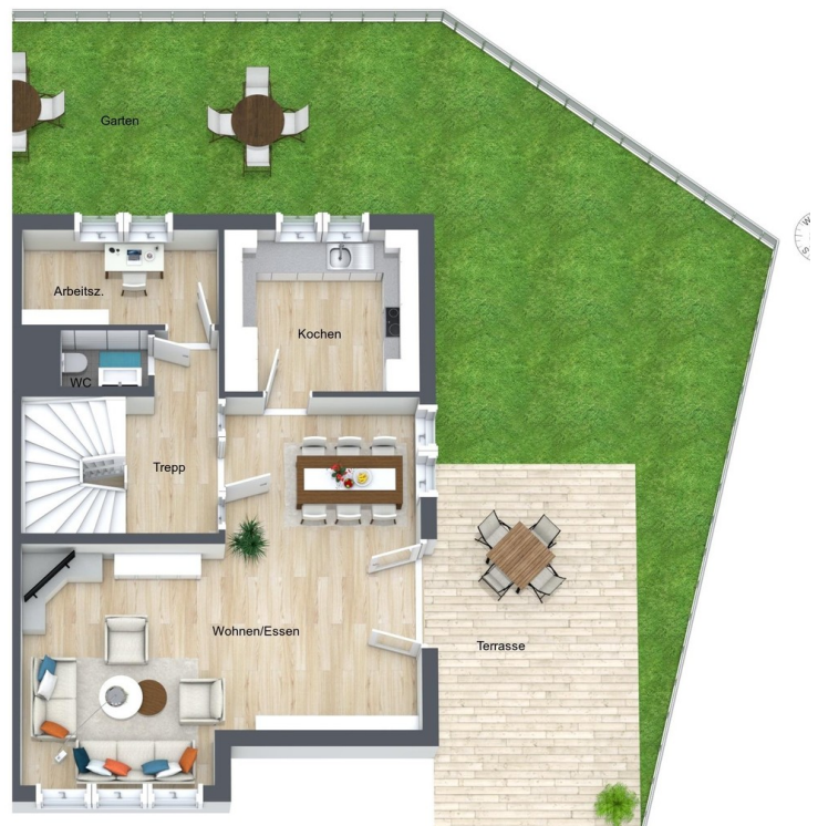
Grundriss 1. OG