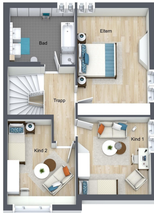
Grundriss 2. OG