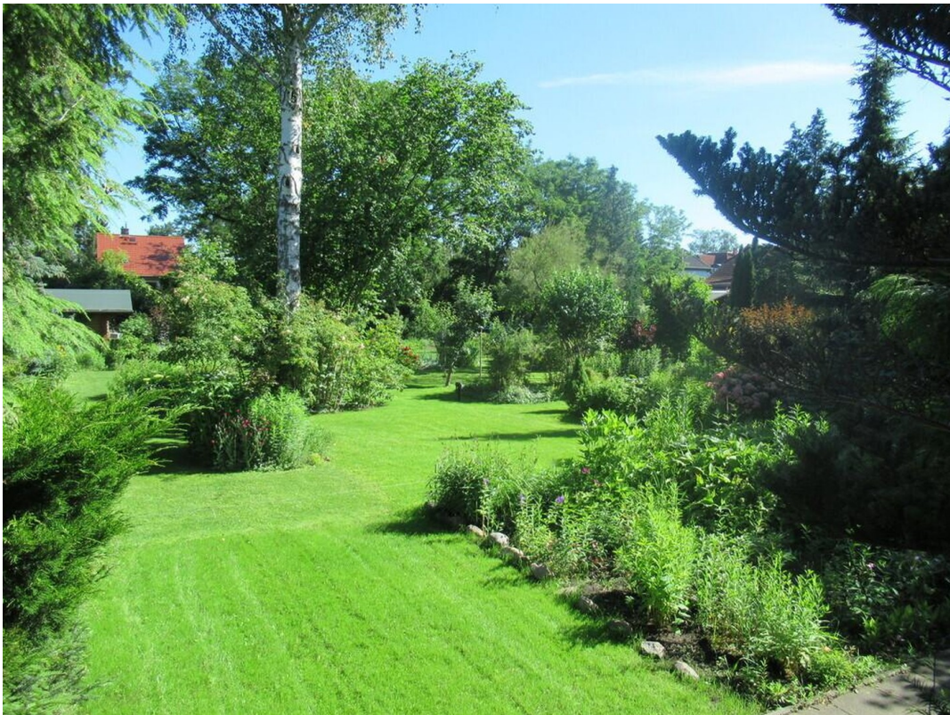
Blick in den großen Garten