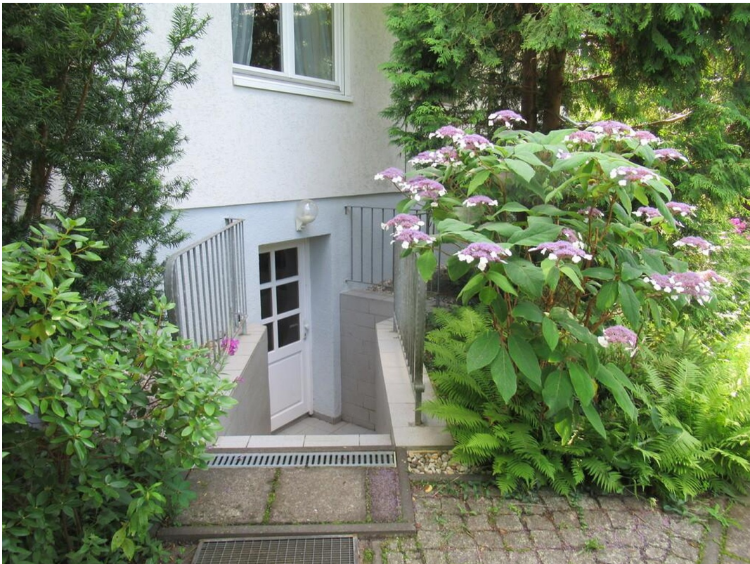
Außenzugang zum Keller