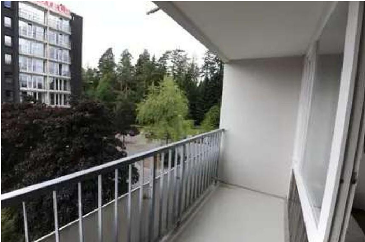
Balkon 1 von zwei Balkonen