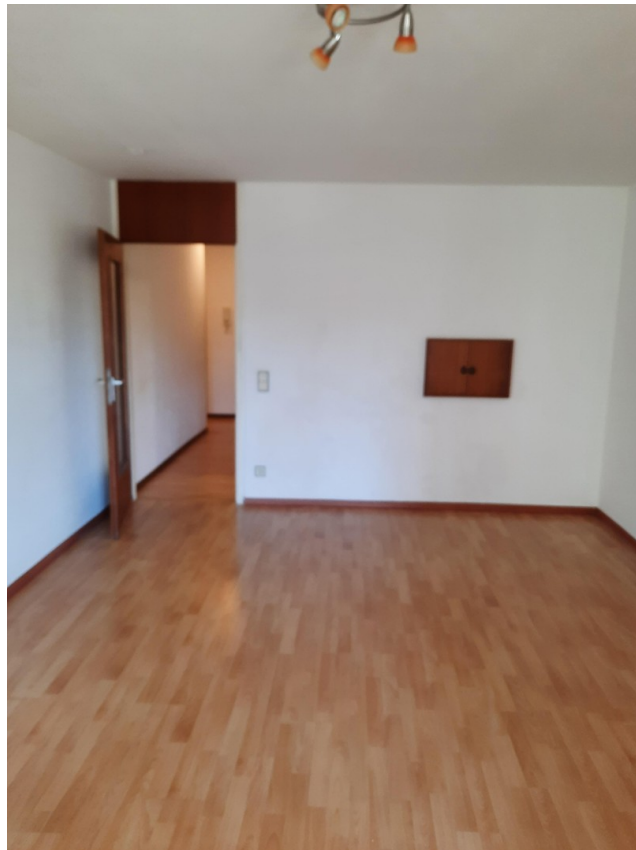
Wohnzimmer mit Essecke