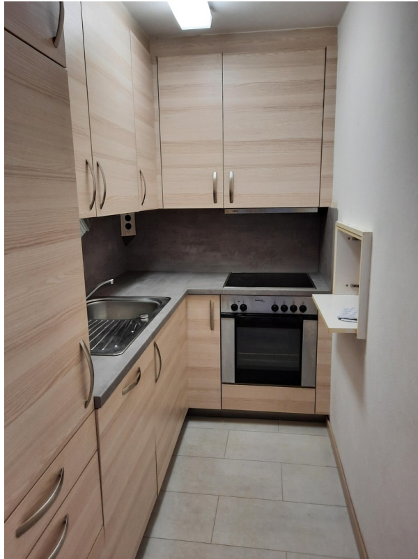
Küche mit Durchreiche