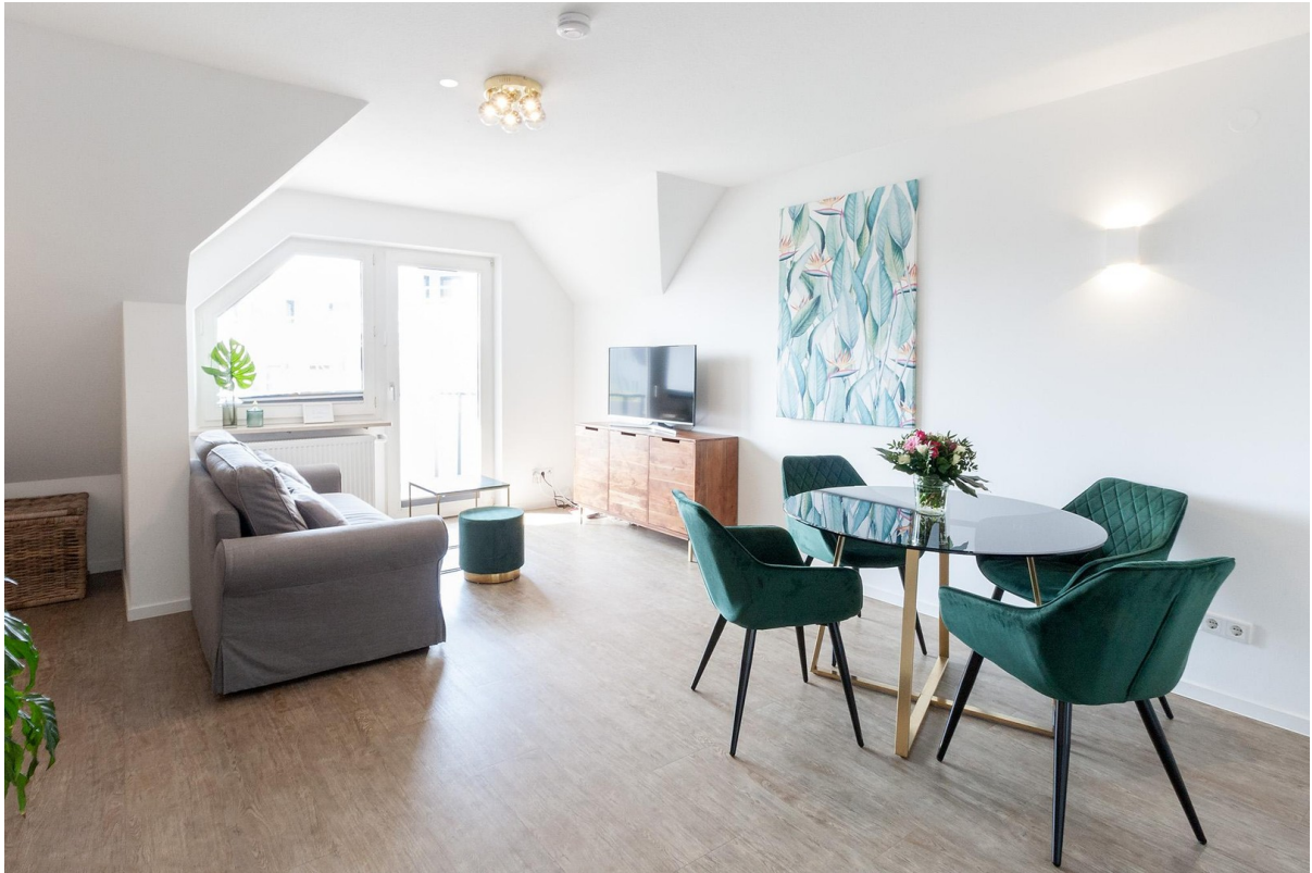
Smart TV & Internet