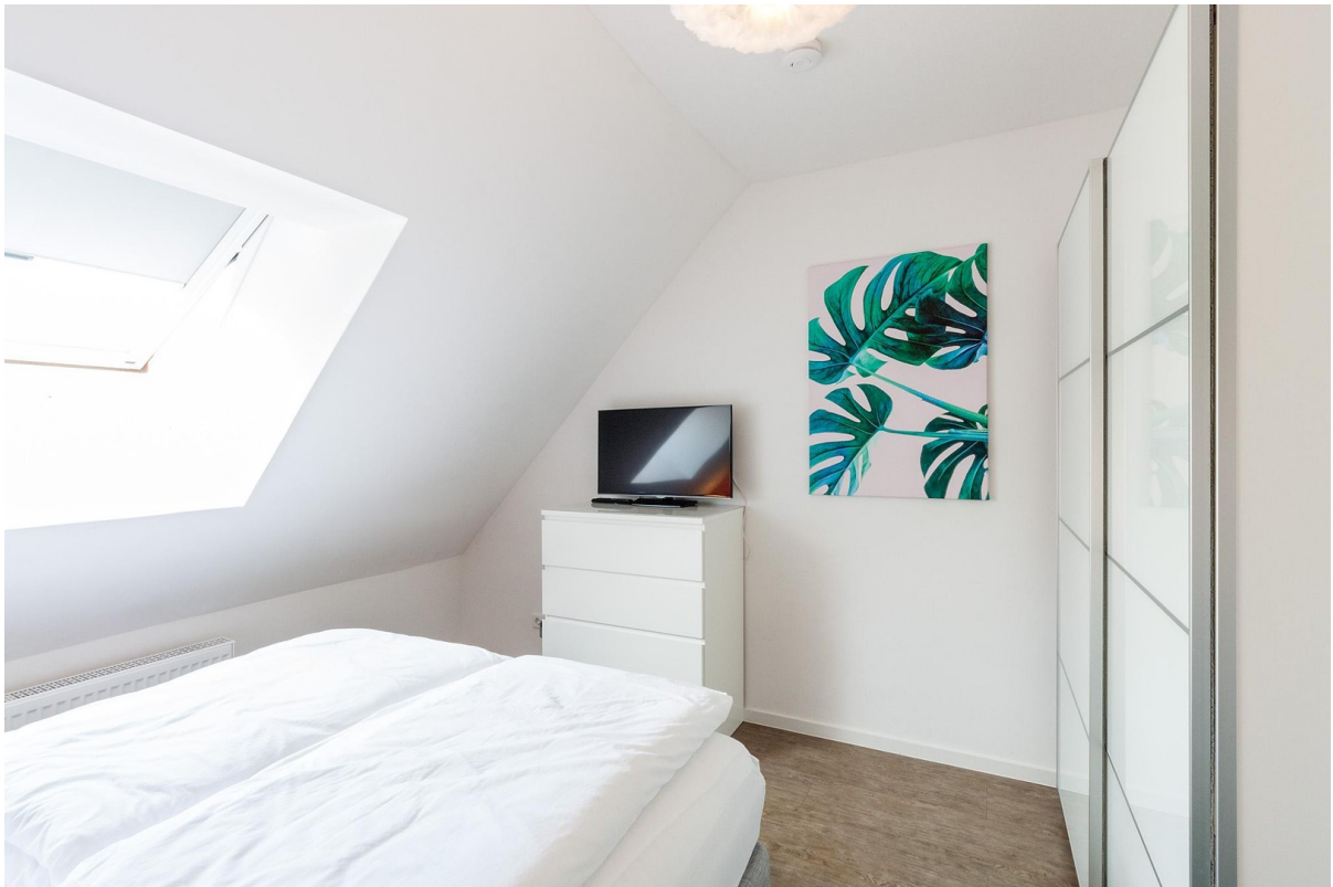
2 Smart TVs