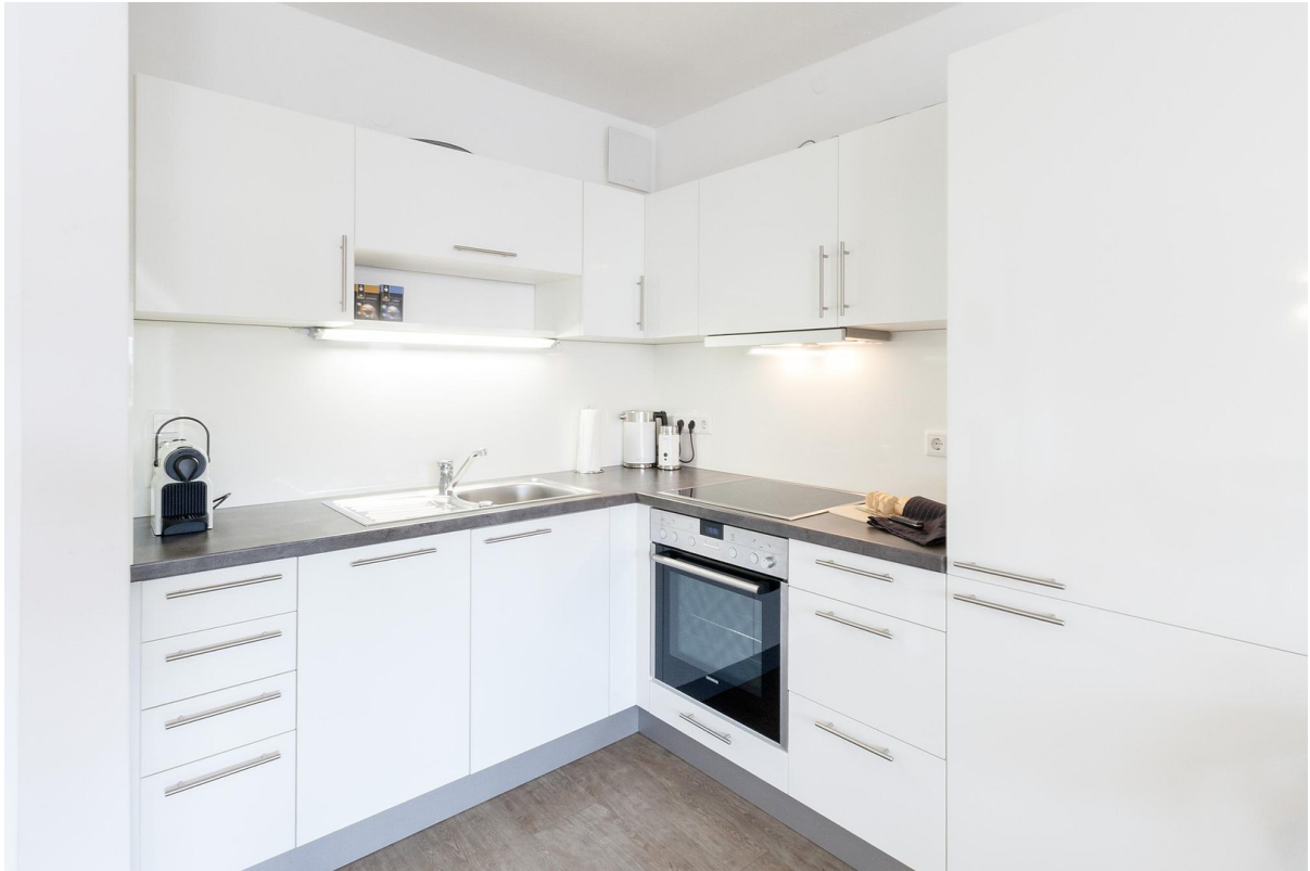
Einbauküche mit Geschirr & Co.