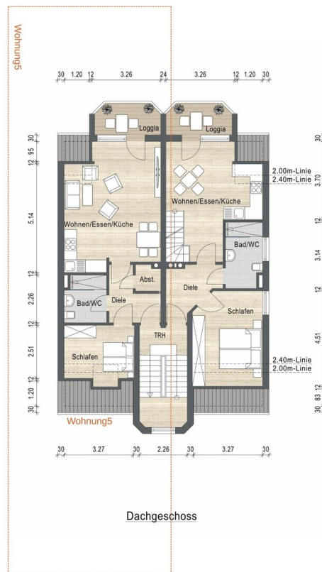
Grundriss Wohnung 5