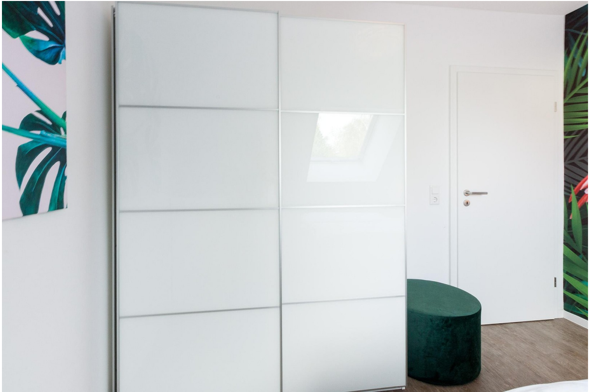
Schrank im Schlafzimmer