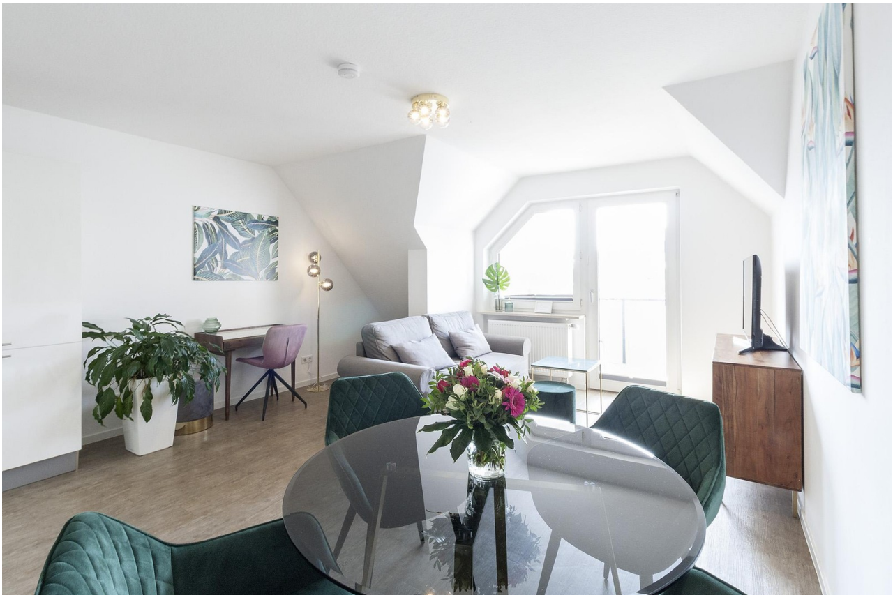
Balkon mit Abendsonne