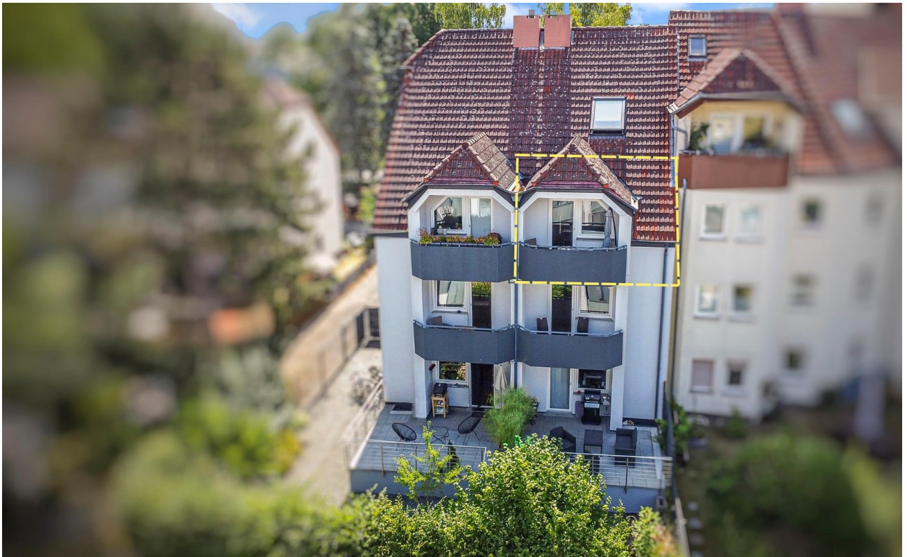
Rückansicht Gebäude Abendsonne