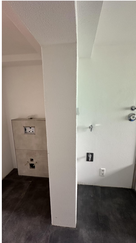
Toilette & Waschmaschine