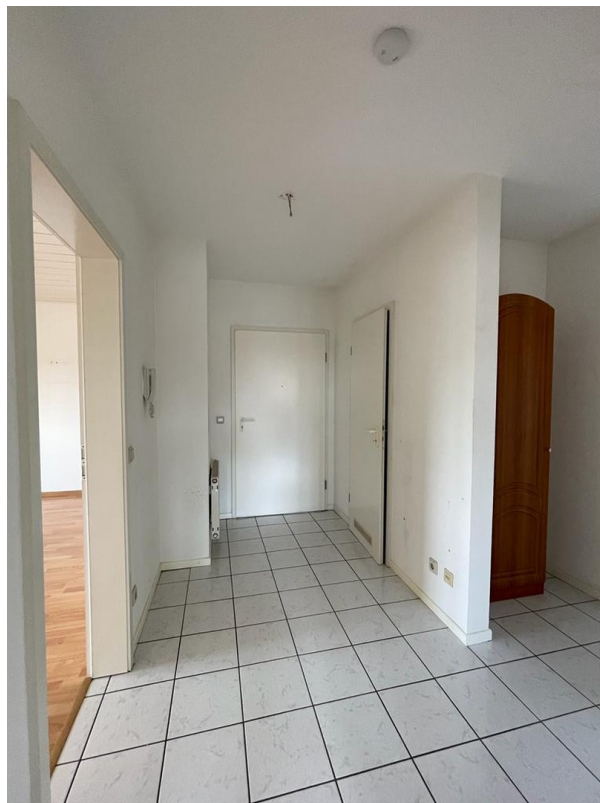
Flur zur Wohnungstür