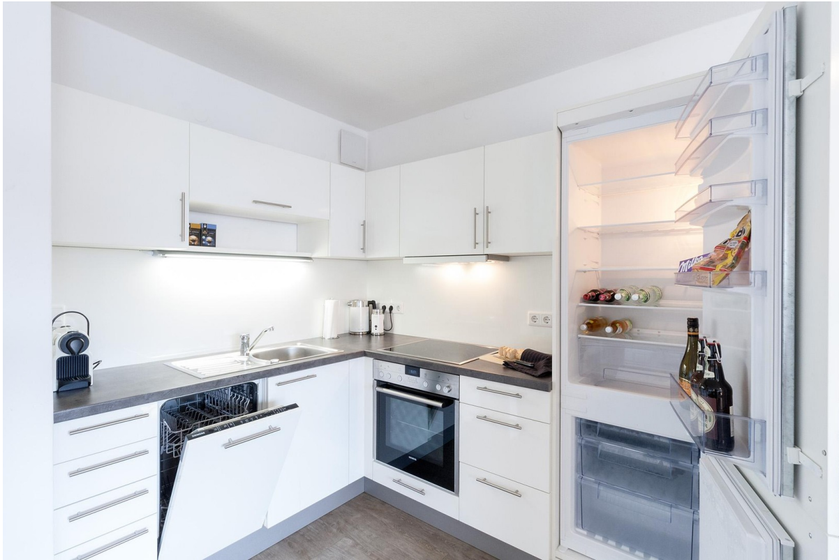
Einbauküche mit Spülmaschine