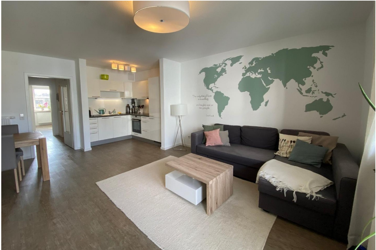
Mustermöblierung Vormieter 2