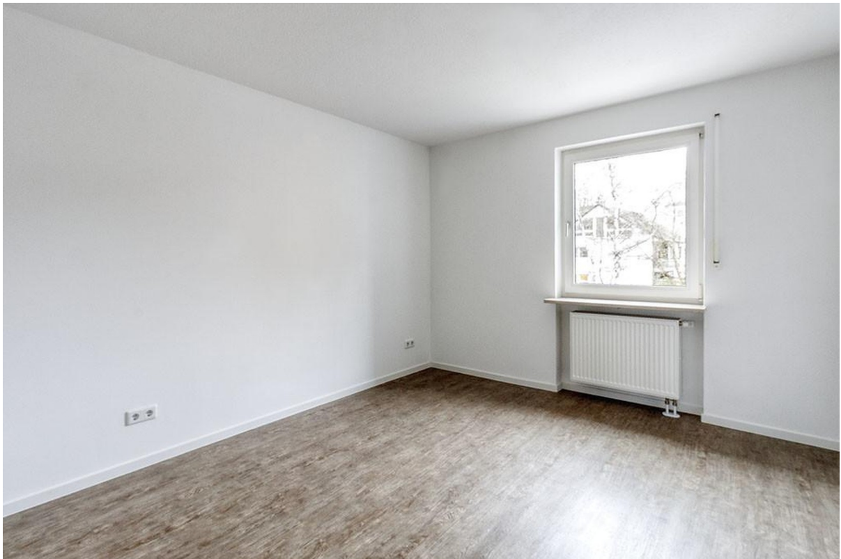
Schlafzimmer mit Morgensonne