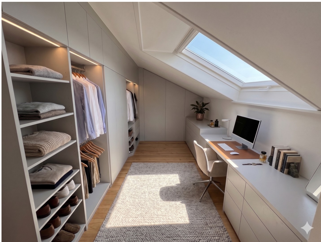
Beispiel Ankleide/Home Office