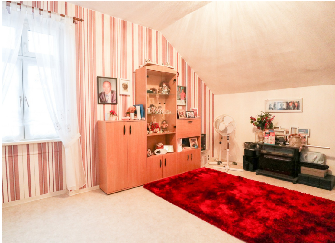
Schlafzimmer 2 OG