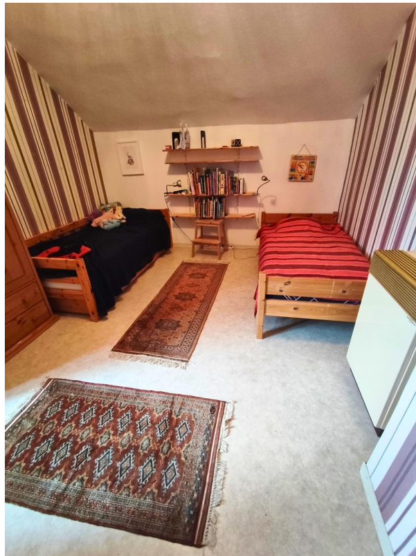
Schlafzimmer (2) OG