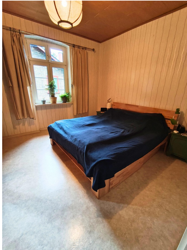
Schlafzimmer (1) OG