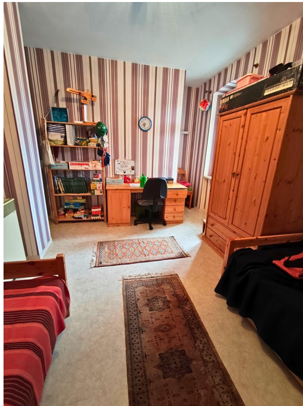
Schlafzimmer (2) OG