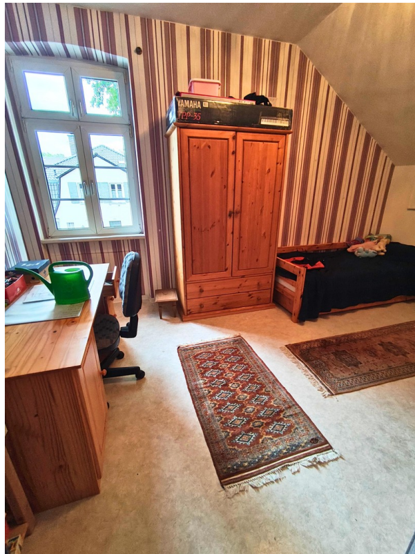
Schlafzimmer (2) OG