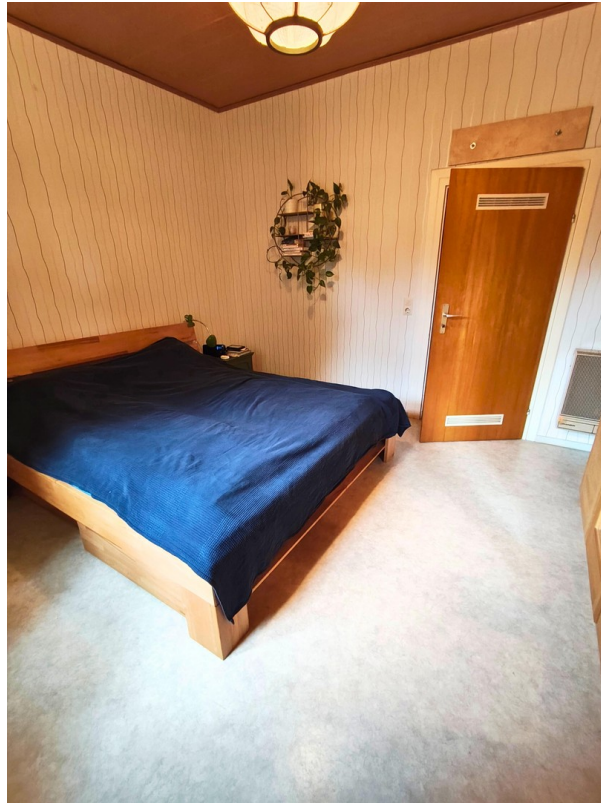
Schlafzimmer (1) OG