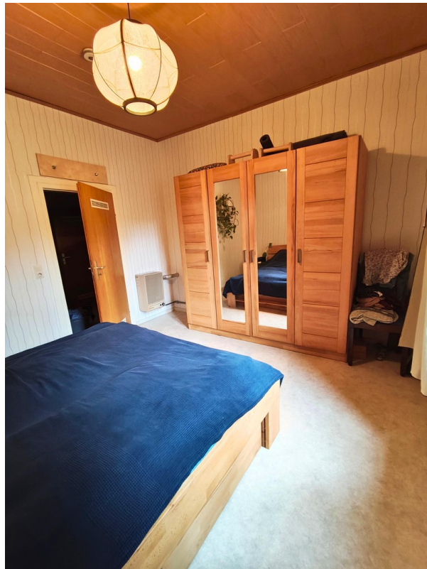
Schlafzimmer (1) OG