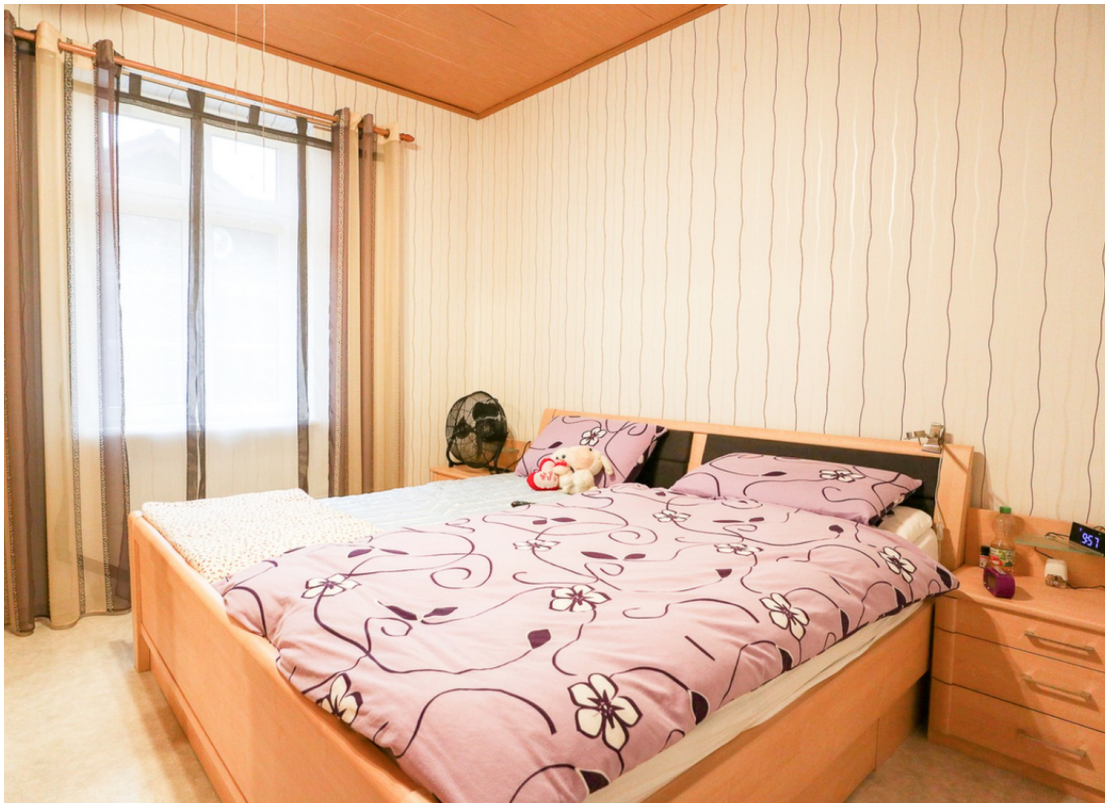
Schlafzimmer 1 OG