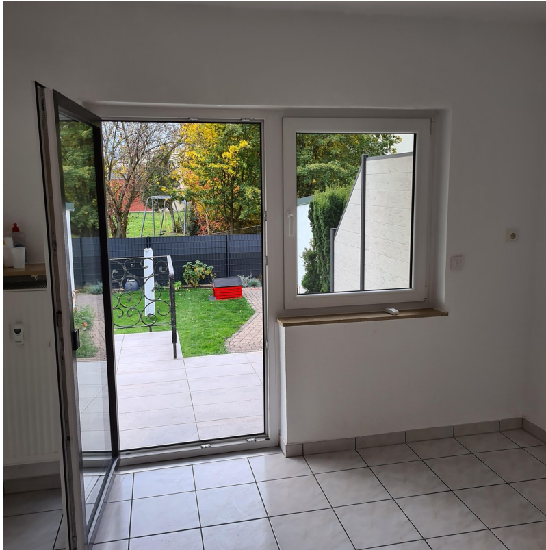
Küche mit Terrasse