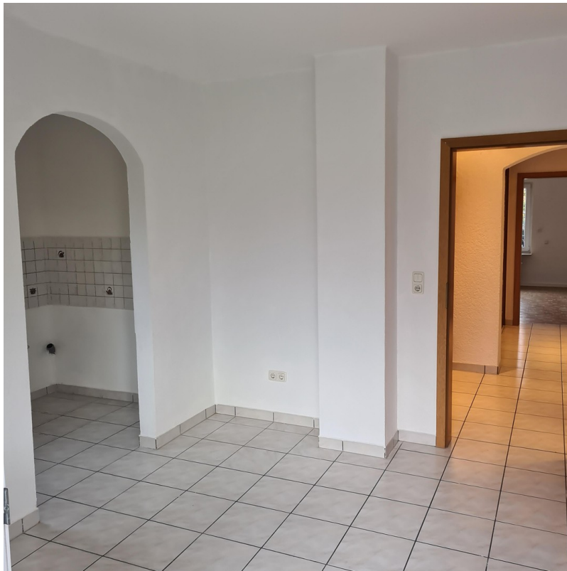
Küche mit Kochnische