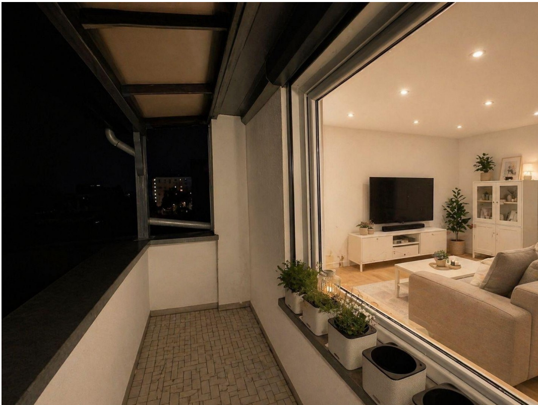
Balkon, Loggia, WoZi