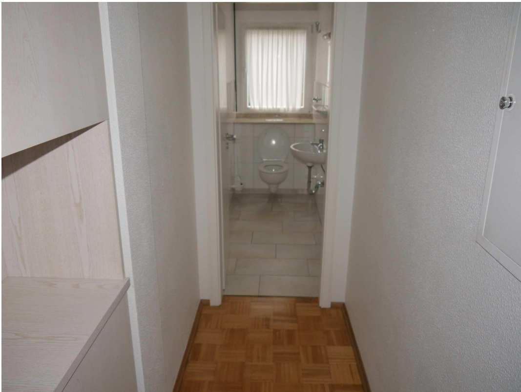
Blick ins G-WC