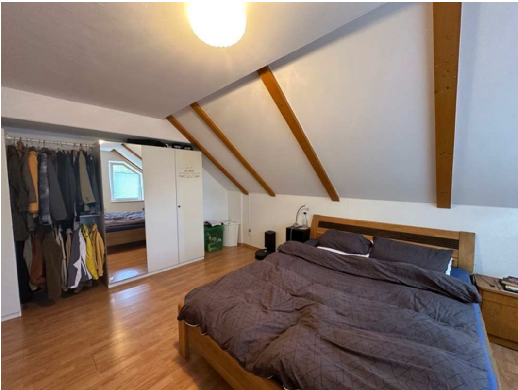
Zimmer 1. OG