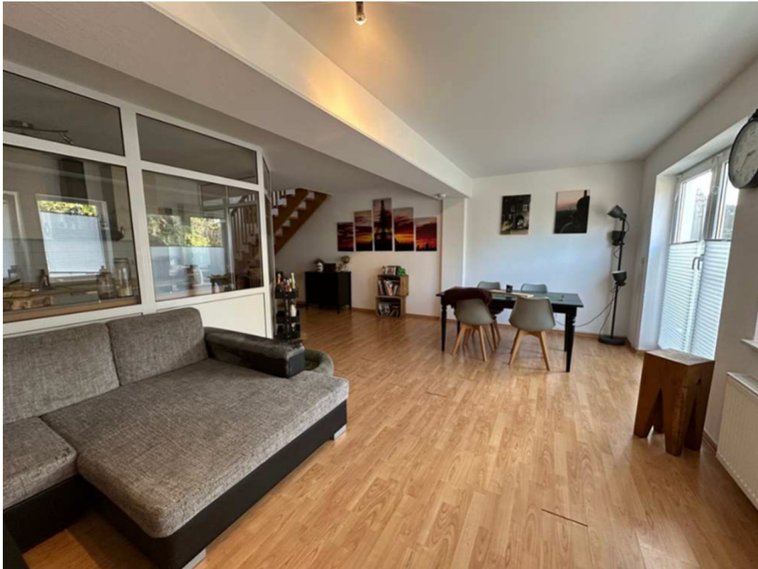
Blick aus Wohnz.