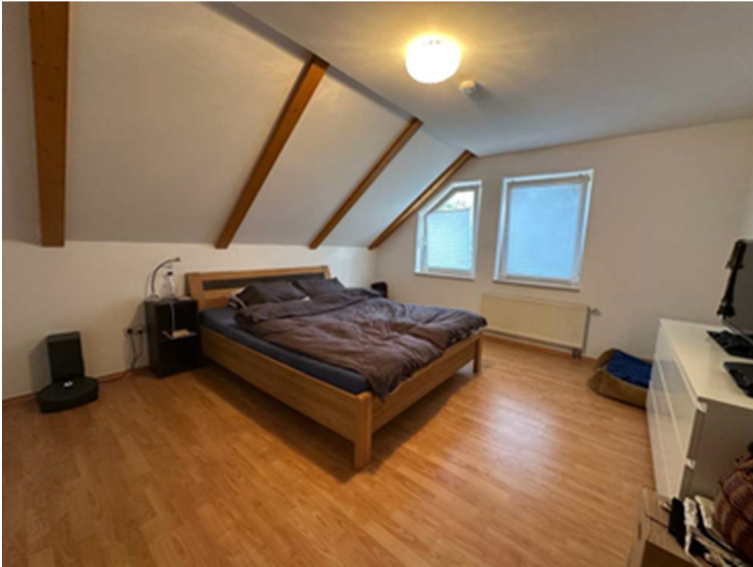
Zimmer 1. OG