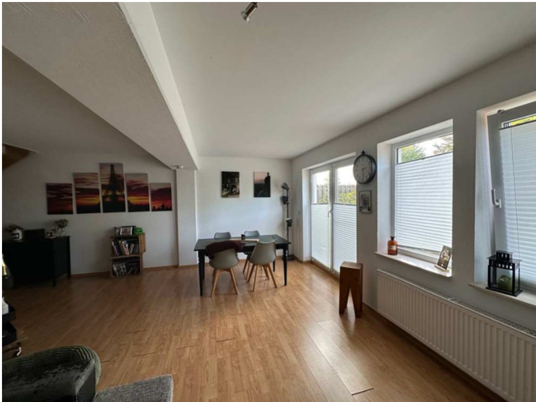
Blick aus Wohnz.