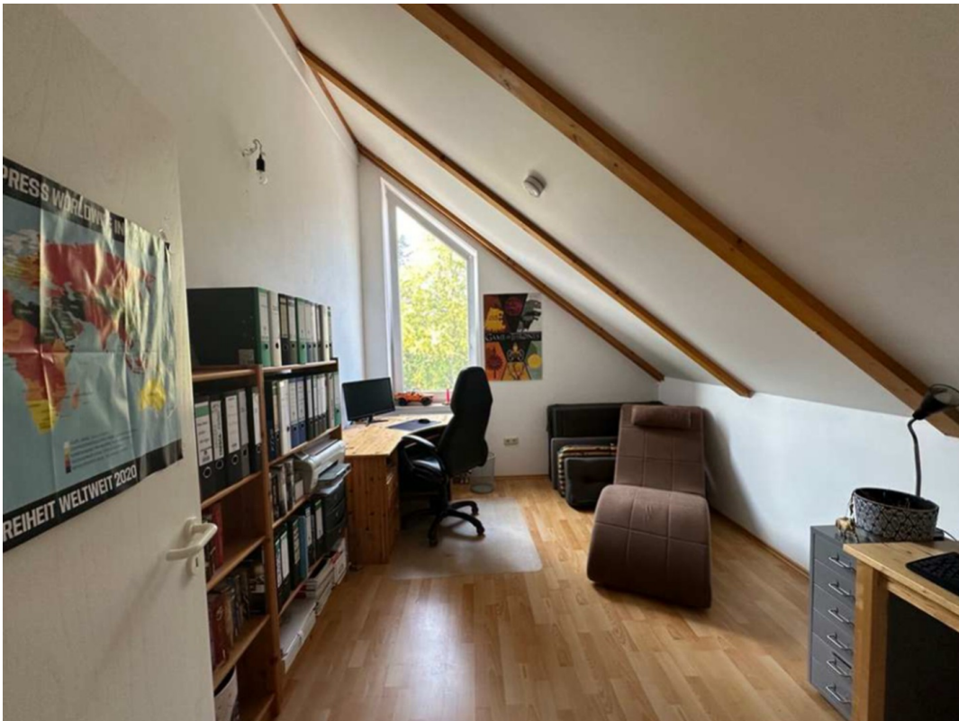
Zimmer 2. OG