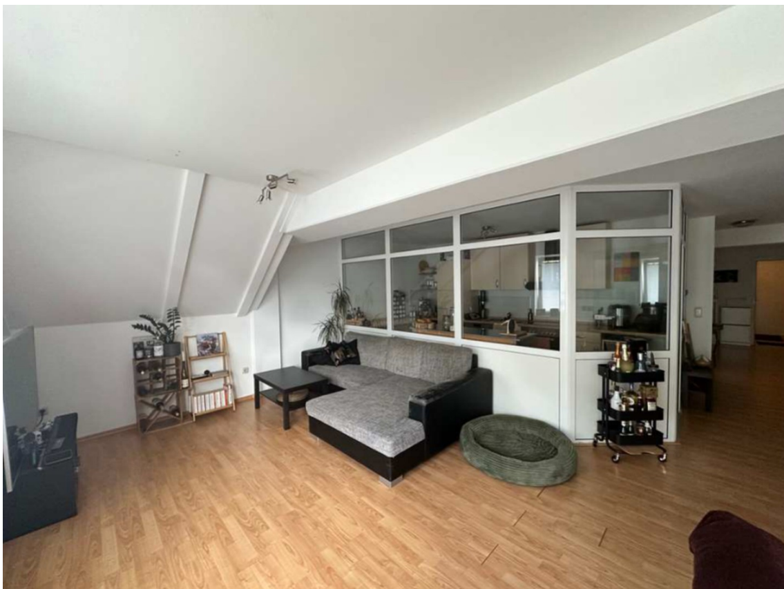
Wohnz. Blick auf Küche