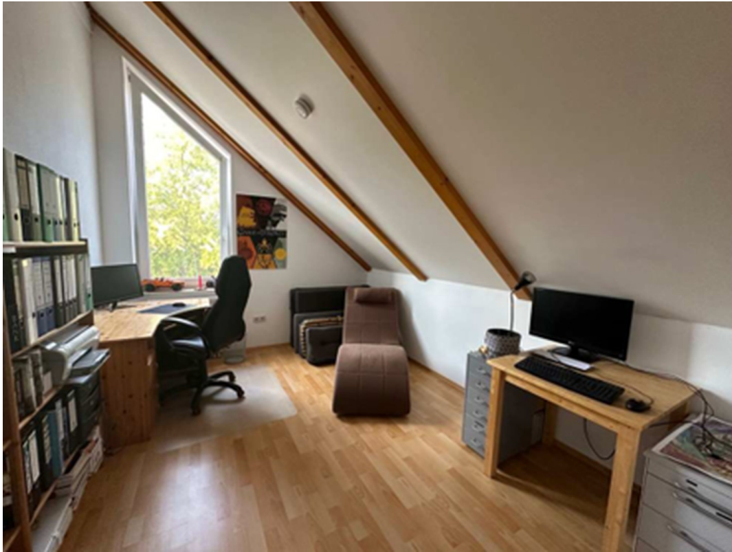
Zimmer 2. OG