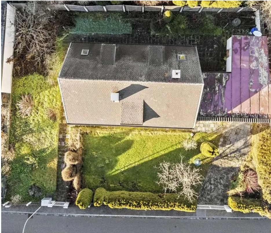
Luftbild - Draufsicht