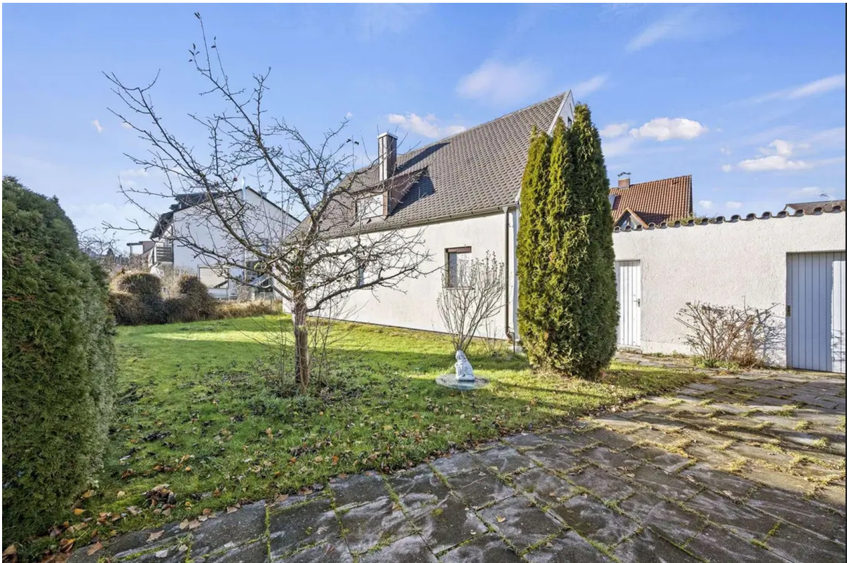
Blick Einfahrt Richtung Haus