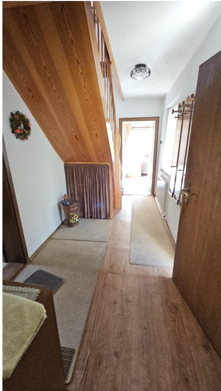
Treppenhaus und Diele EG