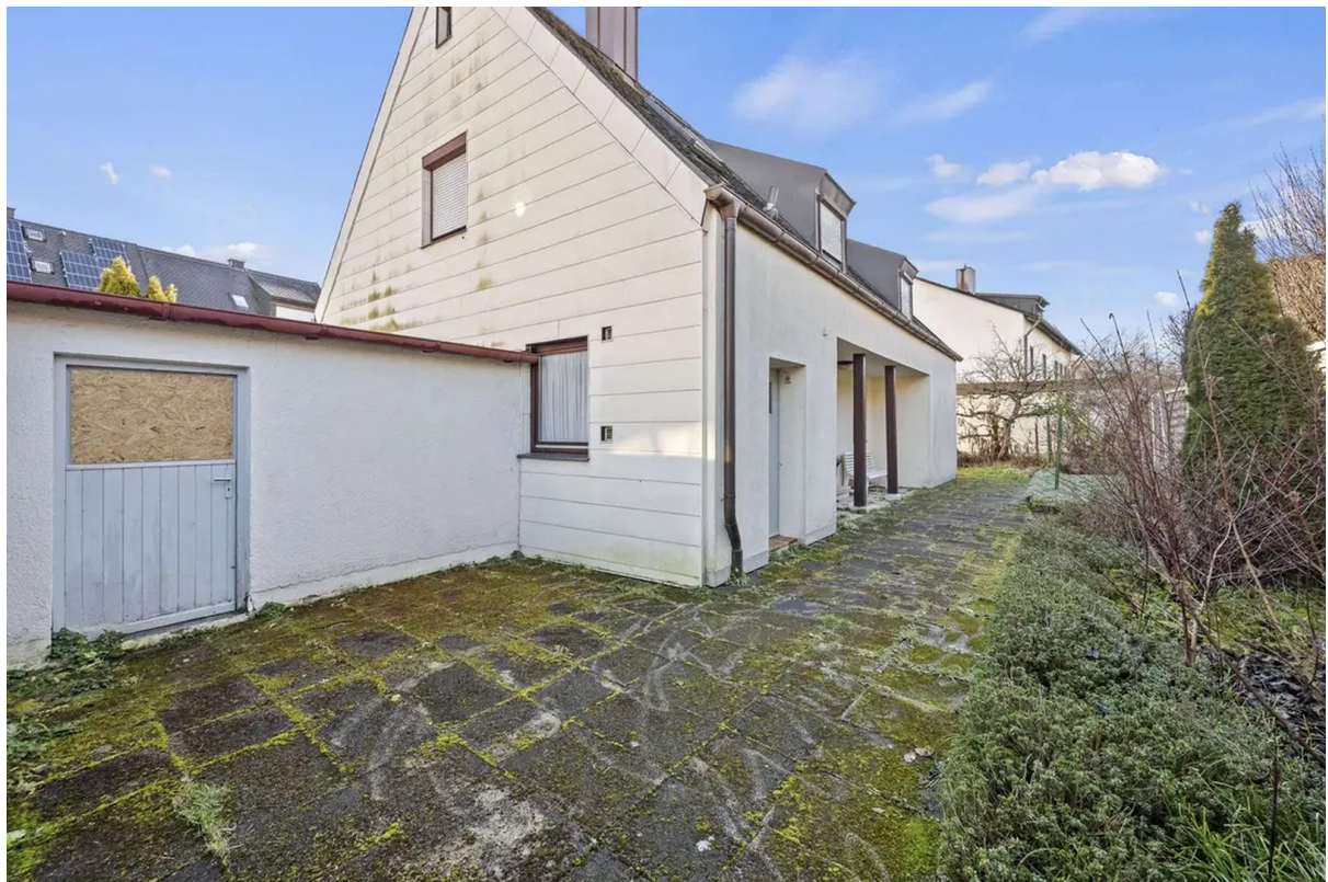
Blick Norden Richtung Haus