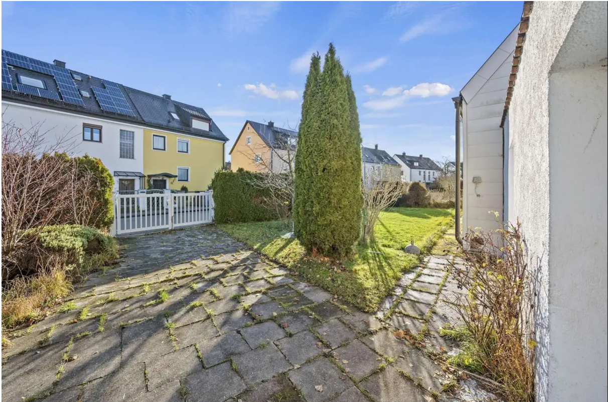
Blick Garage Richtung Garten