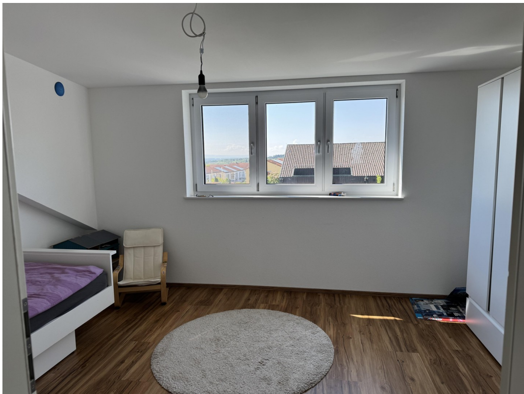
Kind 1 im DG