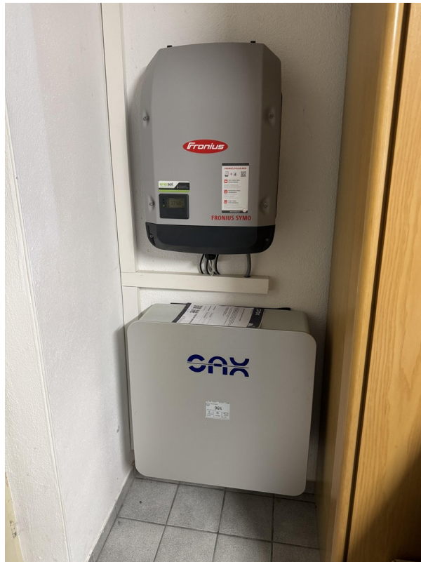
Photovoltaik - Speicher ...