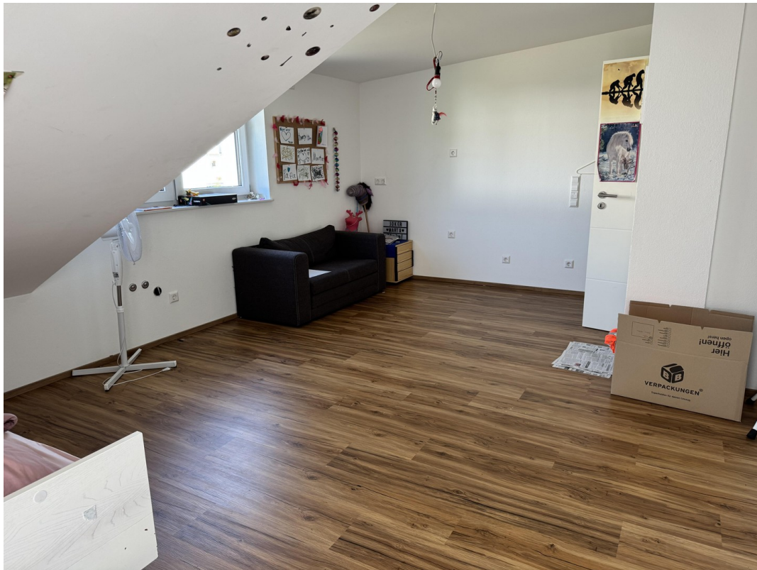
Kind 2 im DG