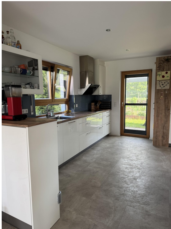
Küche mit Ausgang Garten