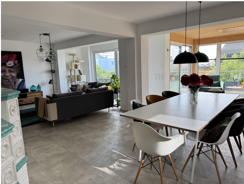
Essen und Wohnen