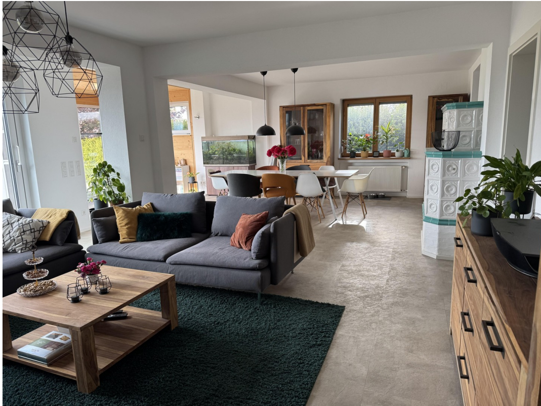
Wohnen mit Blick zum Essbereich