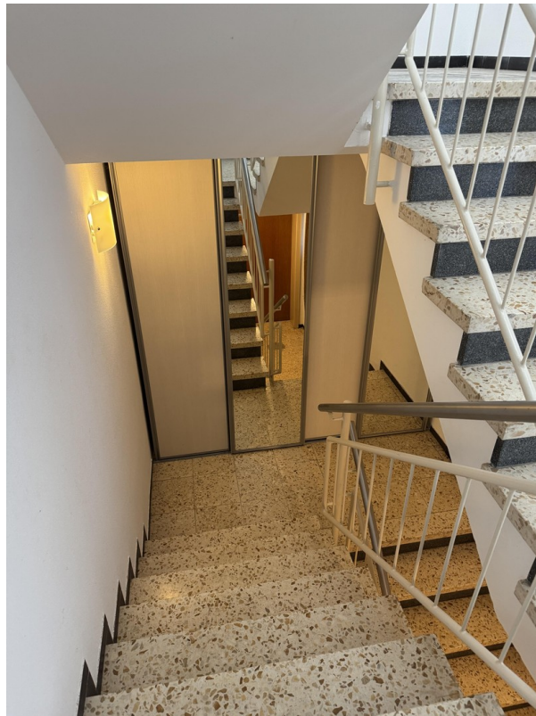
Treppe zum UG