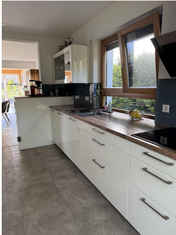
Küche m. Blick zum Essen