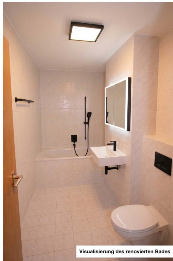
Visualisierung des renovierten Bades