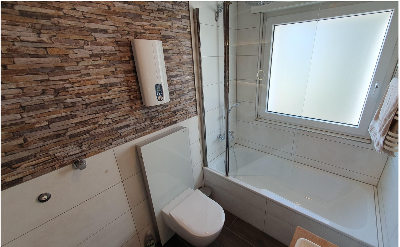
Bad mit Duschwanne