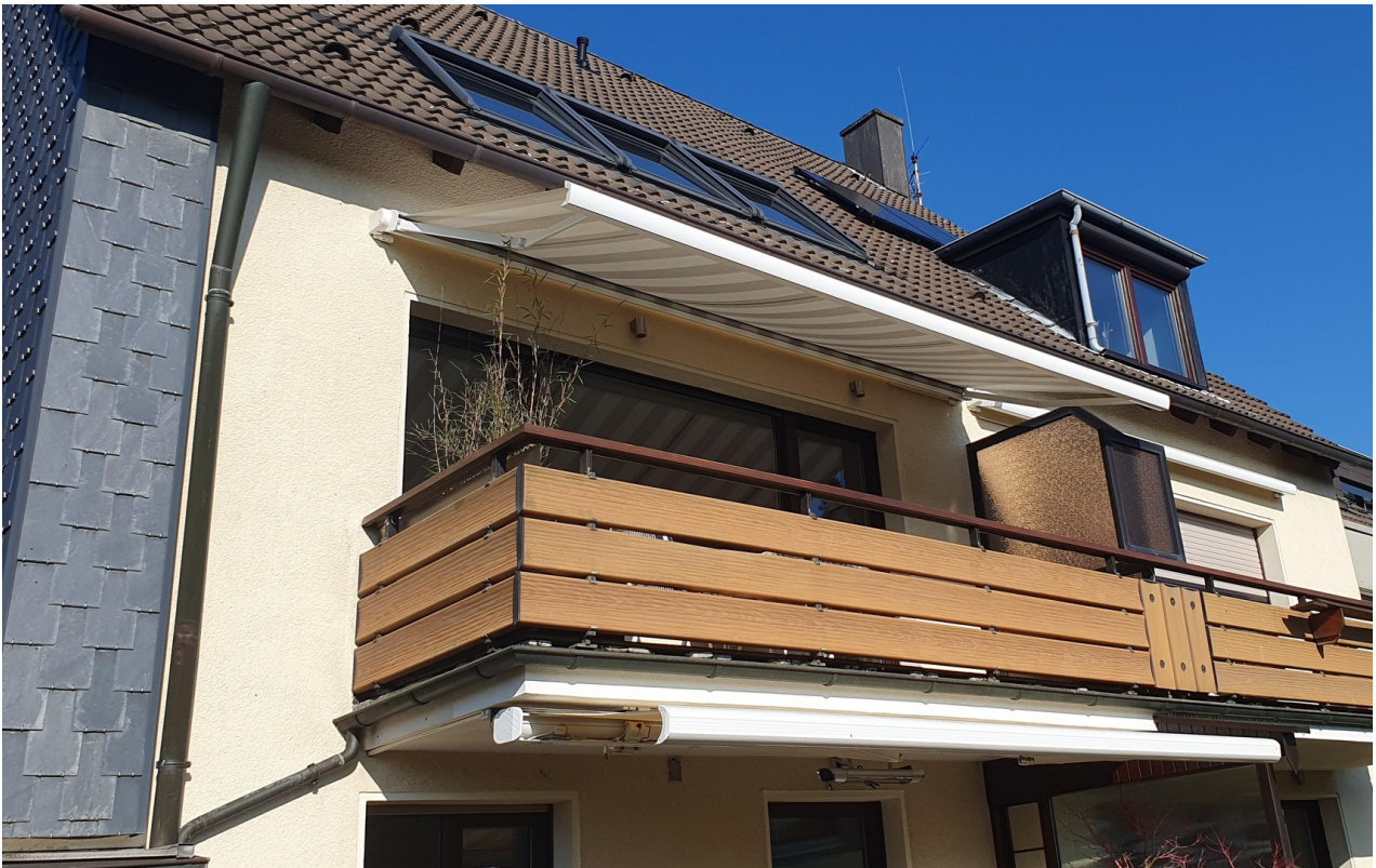
Balkon vom Garten