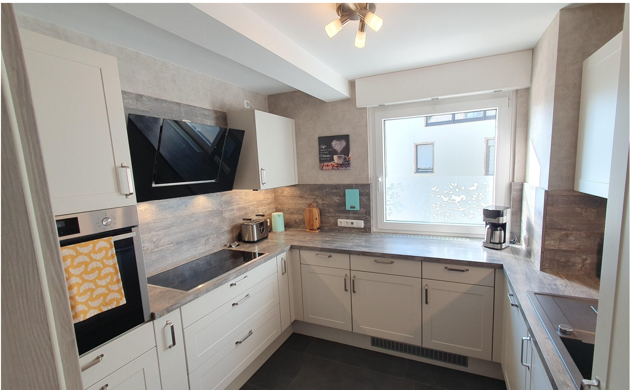
Küche vom Flur