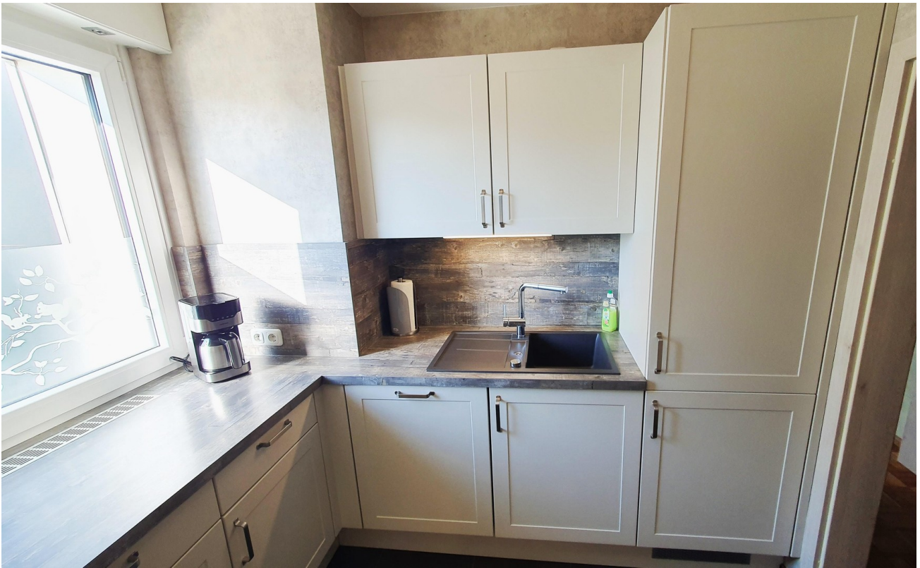
Küche mit Spüle