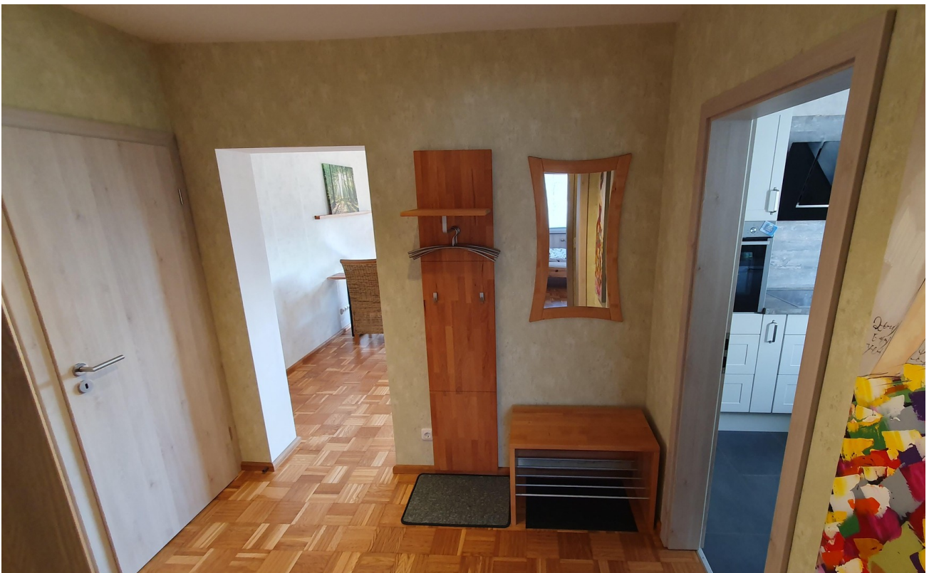
Flur Richtung Wohnzimmer