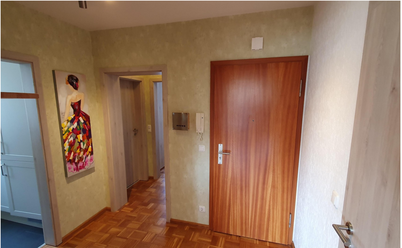
Flur Richtung Bad