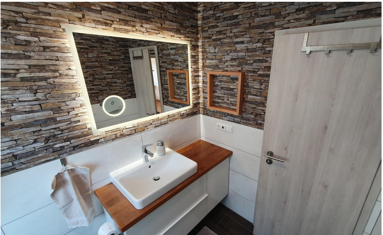
Bad mit Waschtisch