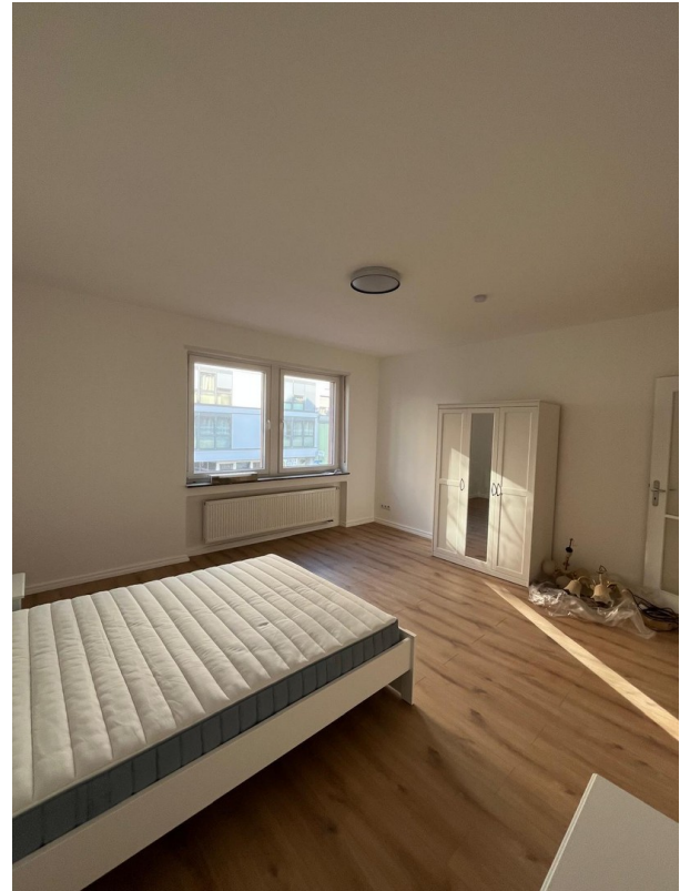
Zi 3 -> 600 € warm inkl. Strom