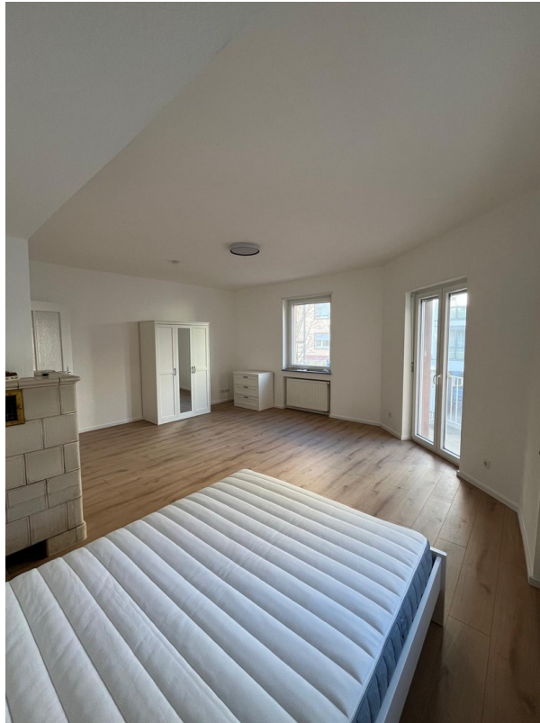
Zi 2 -> 630 € warm inkl. Strom