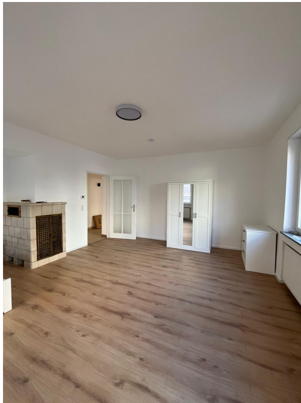
Zi 2 -> 630 € warm inkl. Strom