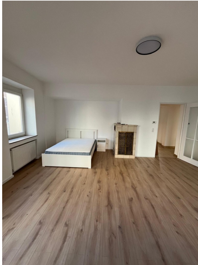
Zi 2 -> 630 € warm inkl. Strom