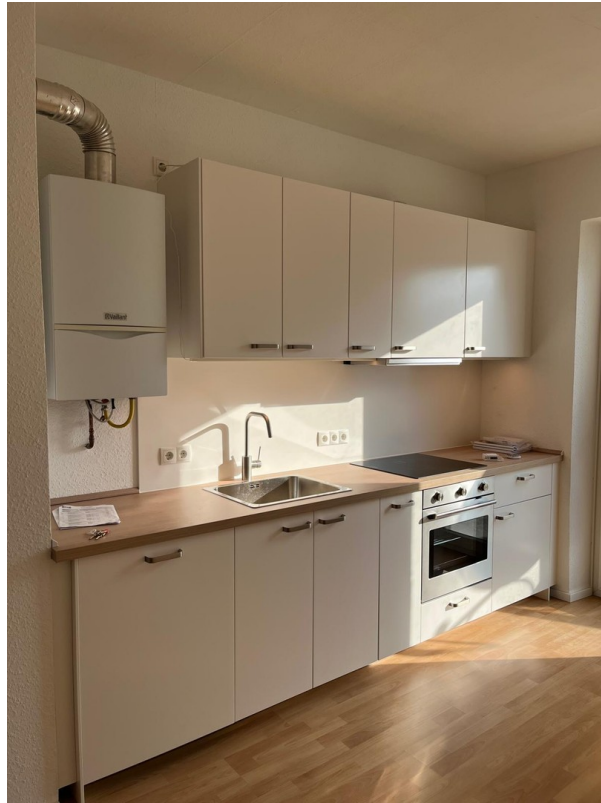
Küche / Gemeinschaftsraum