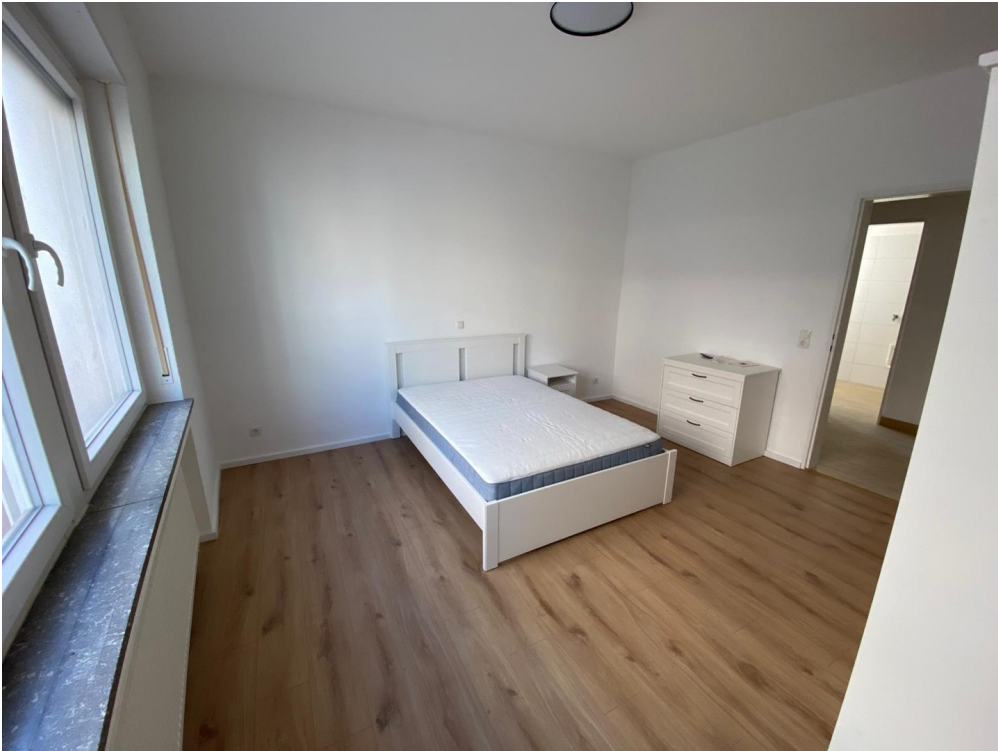
Zi 1 -> 580 € warm inkl. Strom