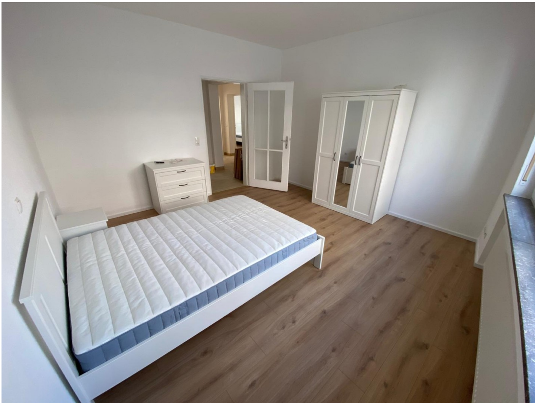
Zi 1 -> 580 € warm inkl. Strom