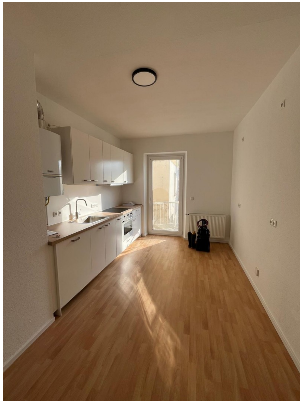
Küche / Gemeinschaftsraum