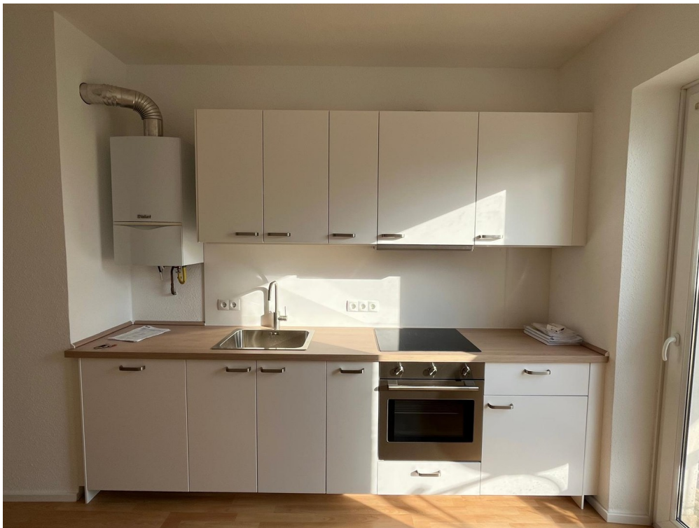
Küche / Gemeinschaftsraum