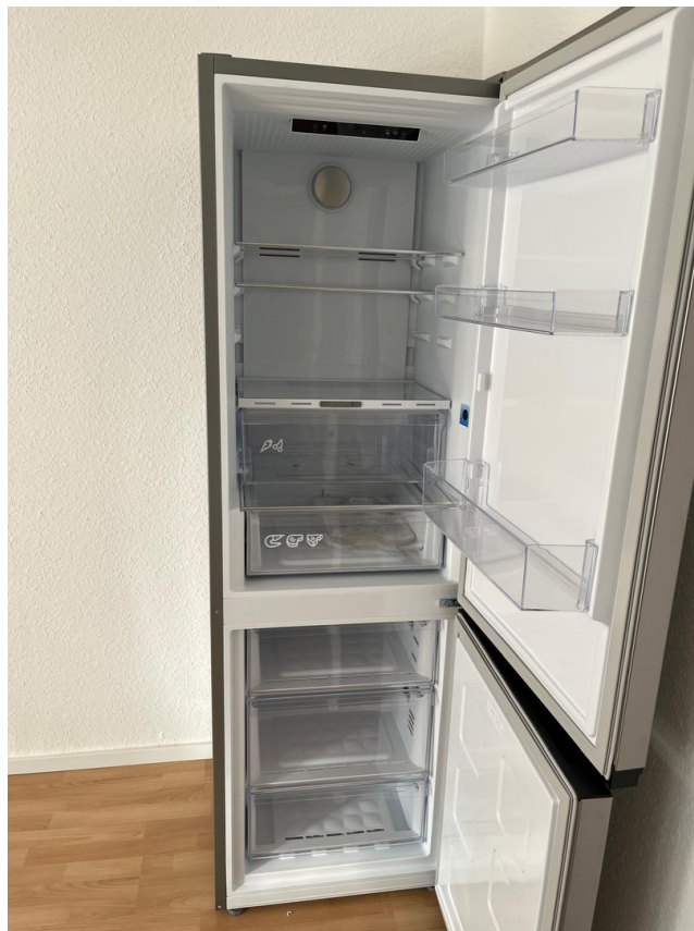
Küche / Gemeinschaftsraum