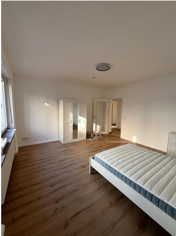
Zi 3 -> 600 € warm inkl. Strom