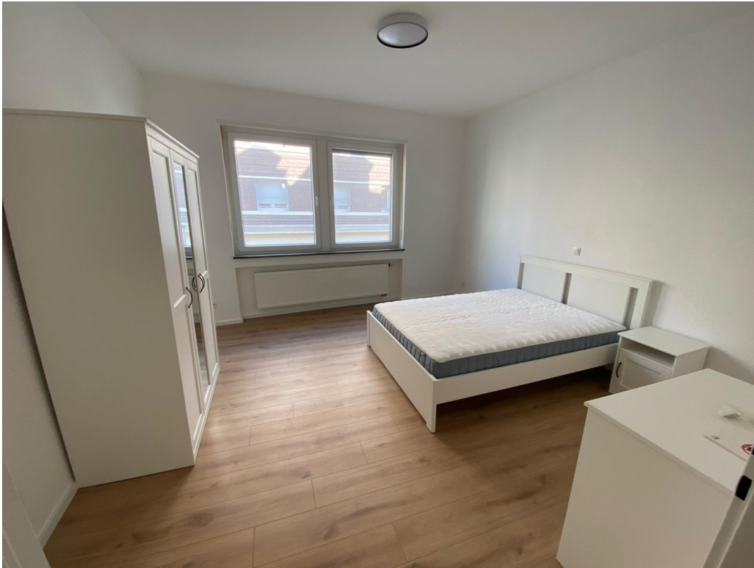
Zi 1 -> 580 € warm inkl. Strom