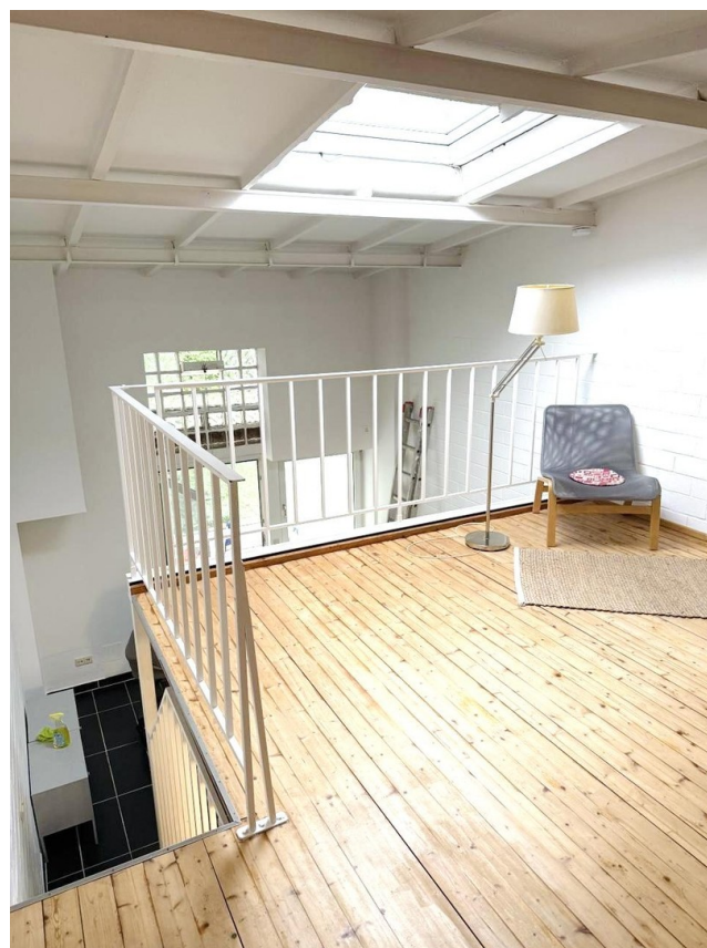
Schlafebene / Homeoffice