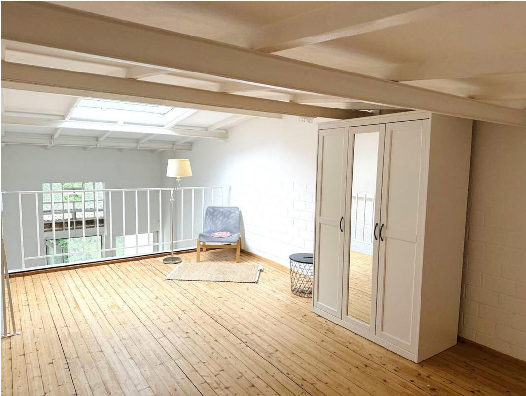
Schlafebene / Homeoffice