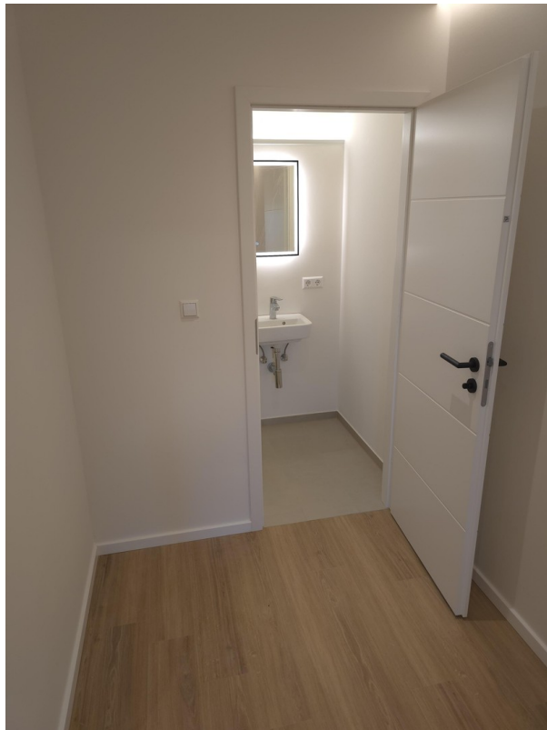
Flur zu separatem WC