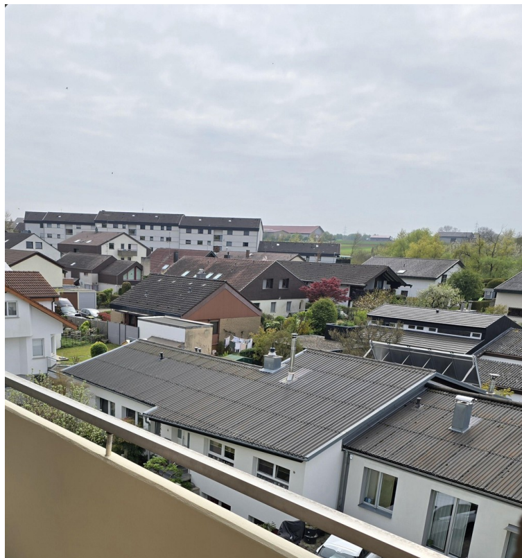
Balkon - Aussicht Süden