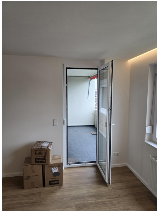
Wohnzimmer - Zugang zum Balkon