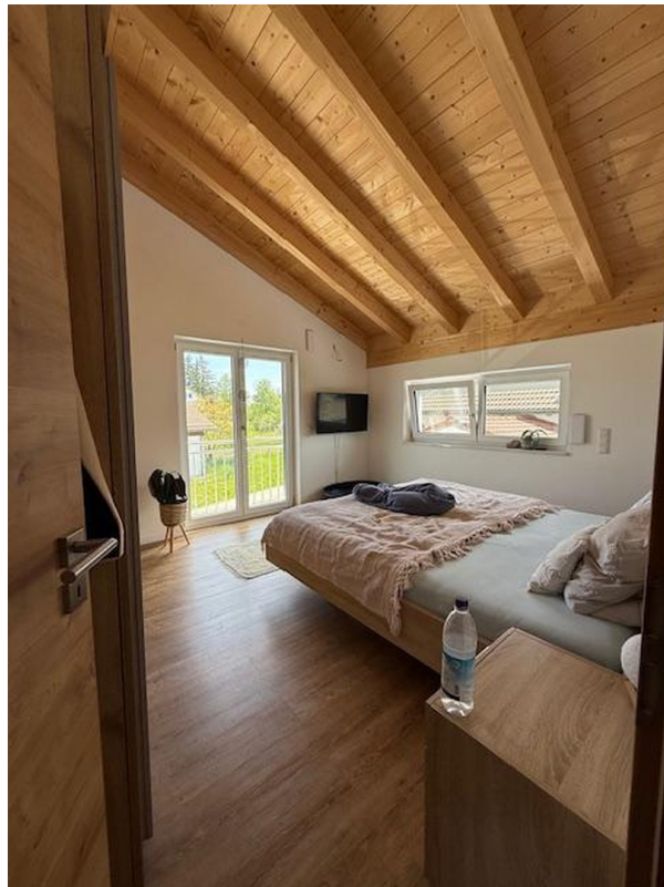
OG Schlafzimmer 2