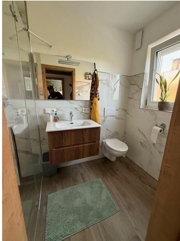
EG Dusche WC_