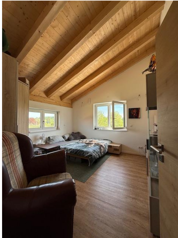
OG Schlafzimmer 1