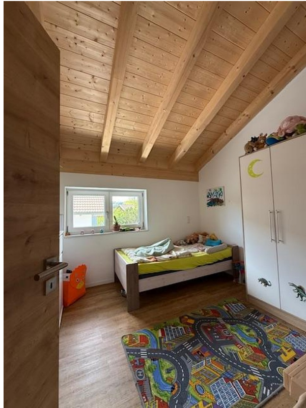
OG Kinderzimmer 3