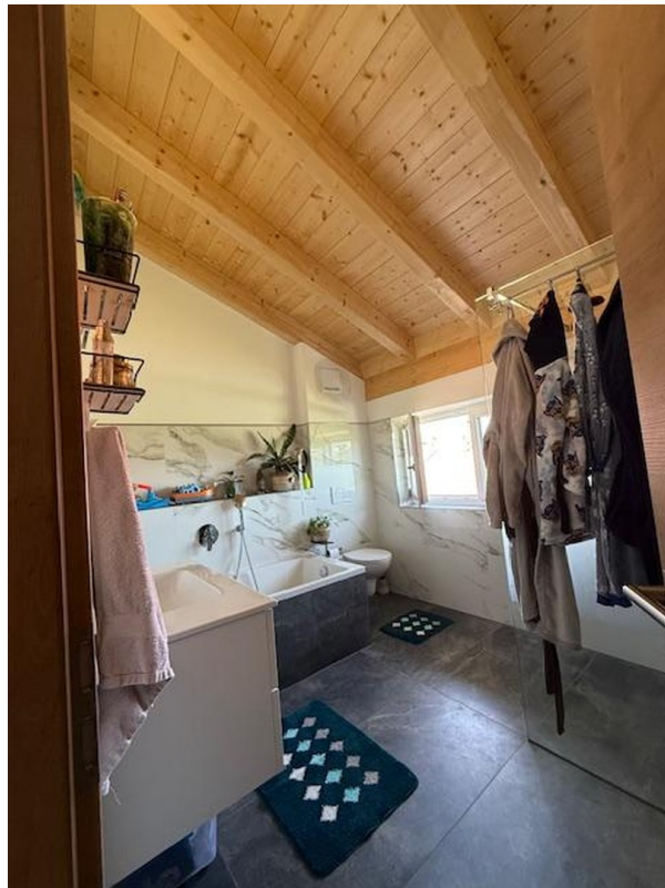
OG Dusche Bad WC