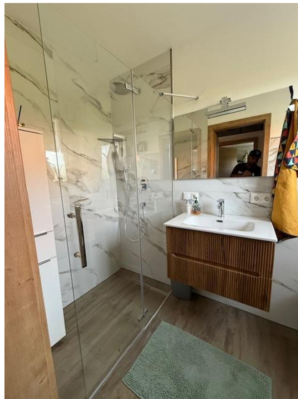
EG Dusche WC