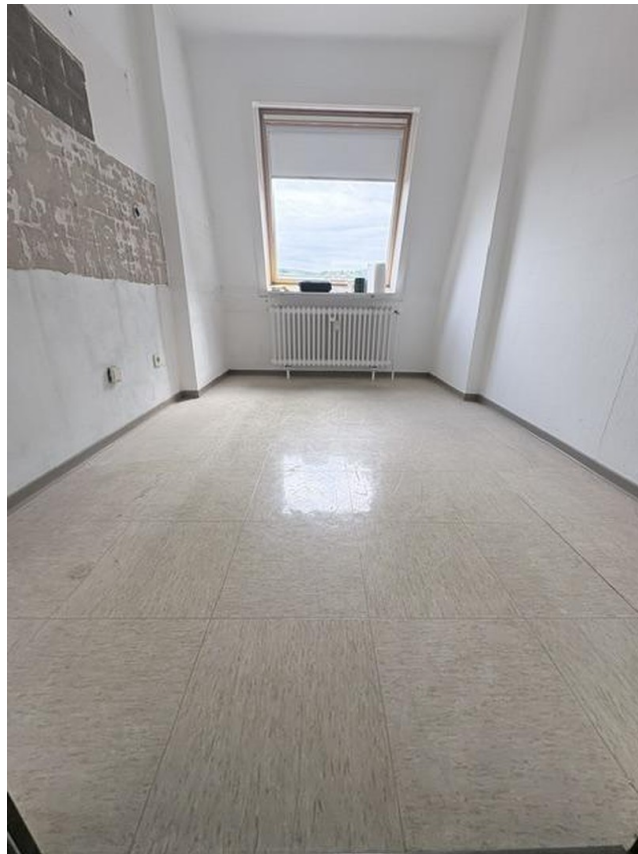
Küche vor Renovierung