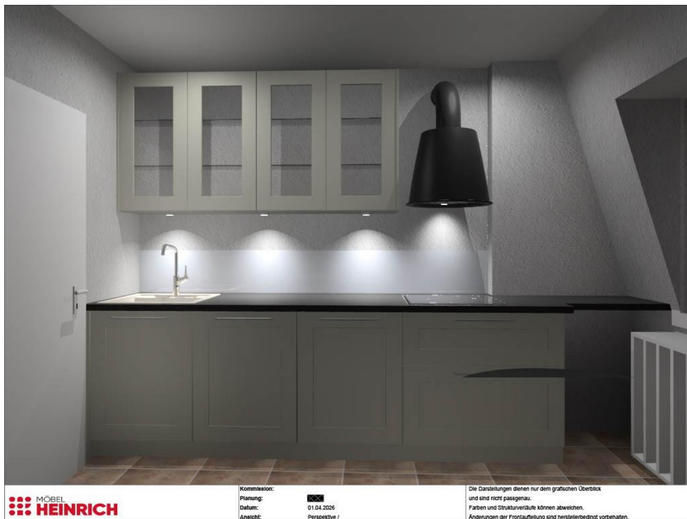
Küchenansicht neue EBK