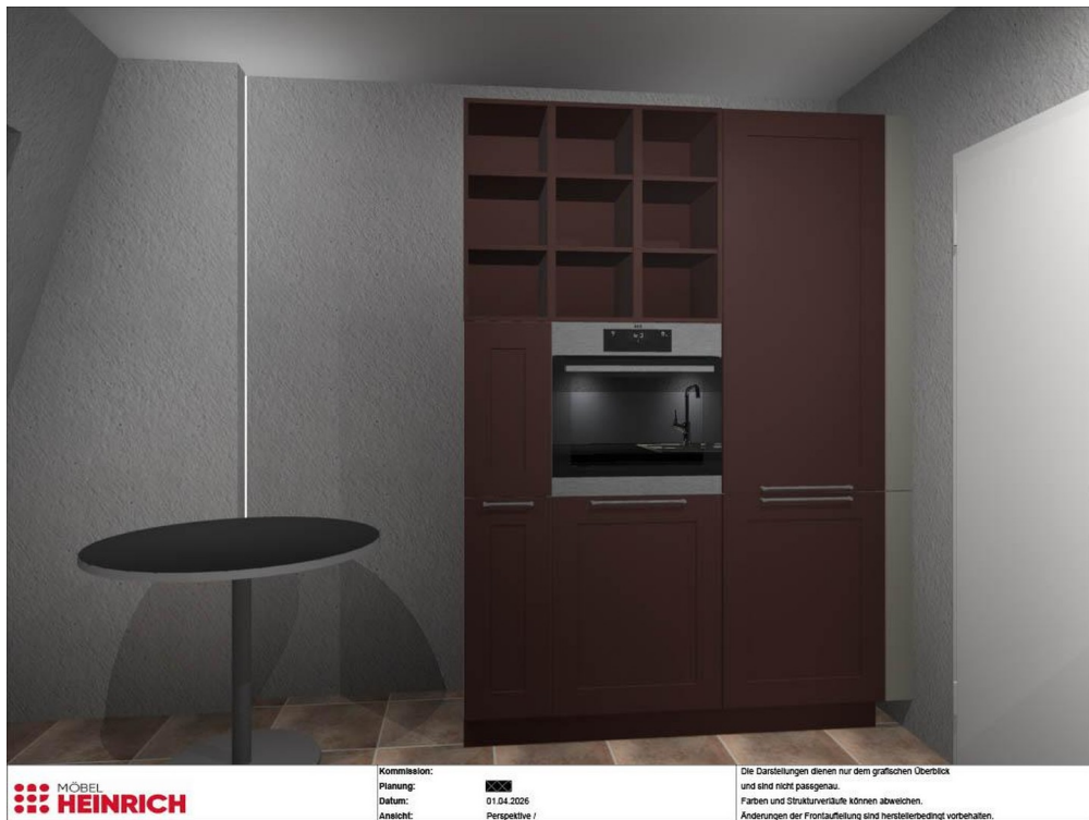
Küchenansicht neue EBK