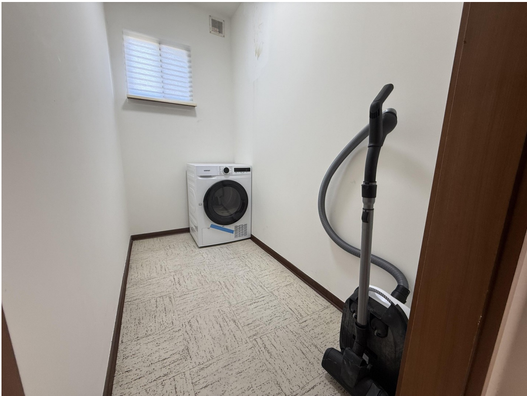
Trockenraum / Abstellkammer