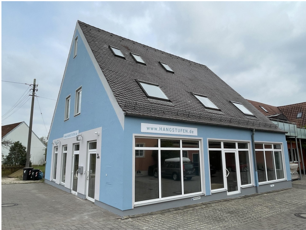
Ansicht Straßenseite 3