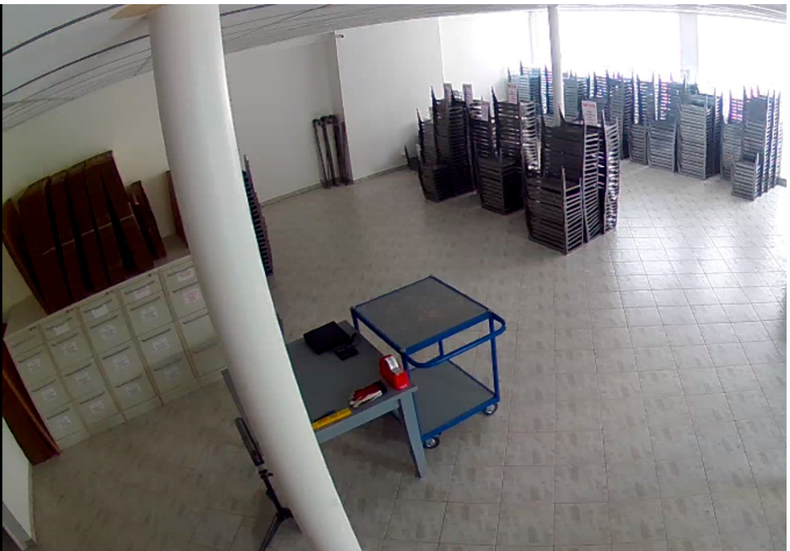
Ansicht innen 2