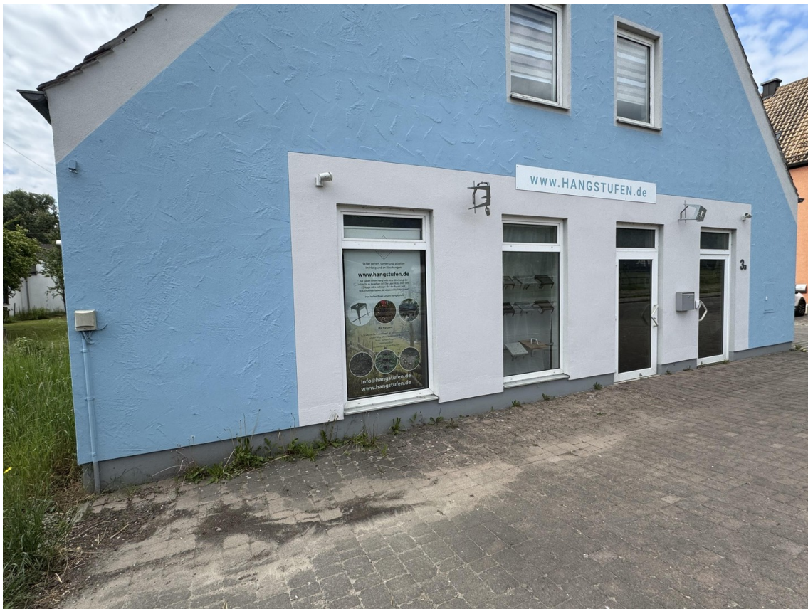
Ansicht Straßenseite 2