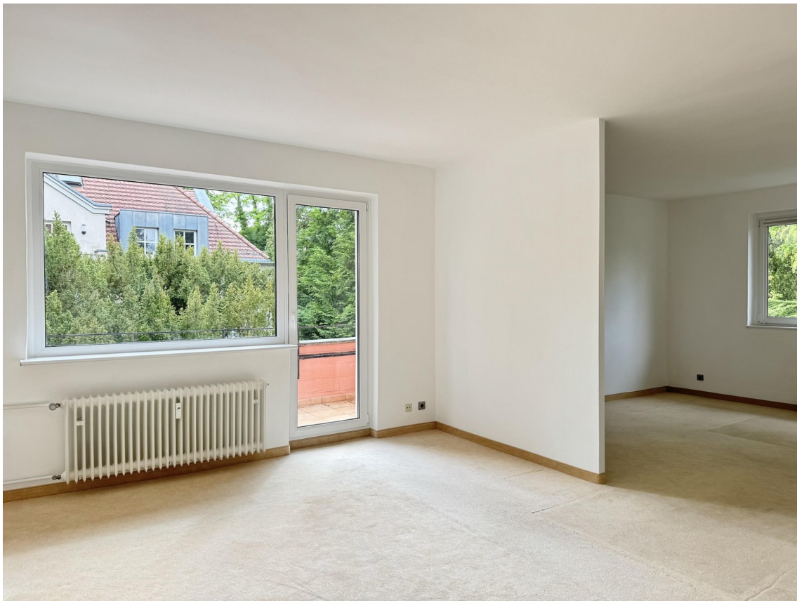
Zimmer 1 und Balkon