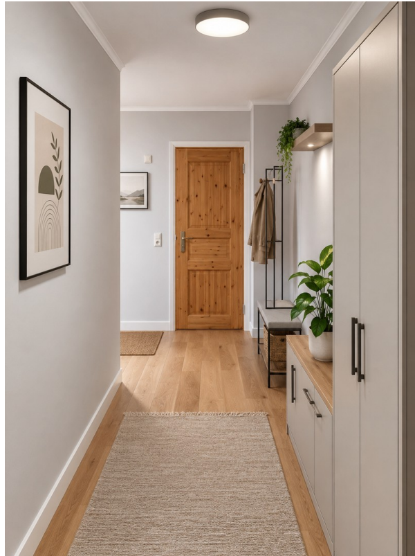
Flur vom Wohnzimmer