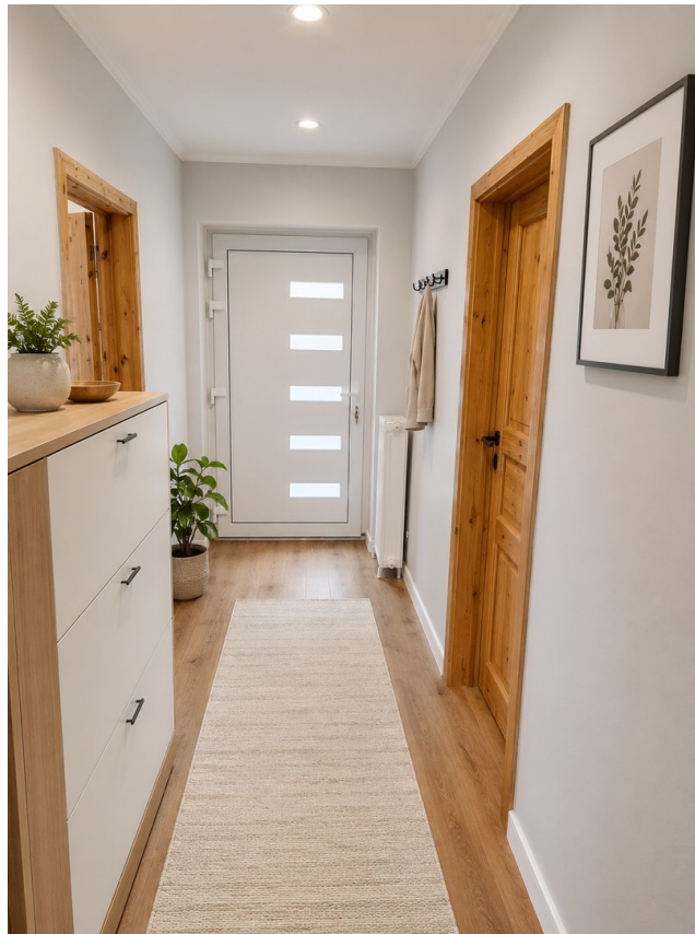
Flur zum Ausgang