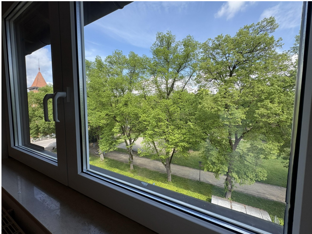
Aussicht Büro / Kinderzimmer