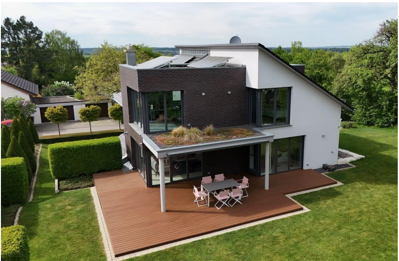
Garten von Süden