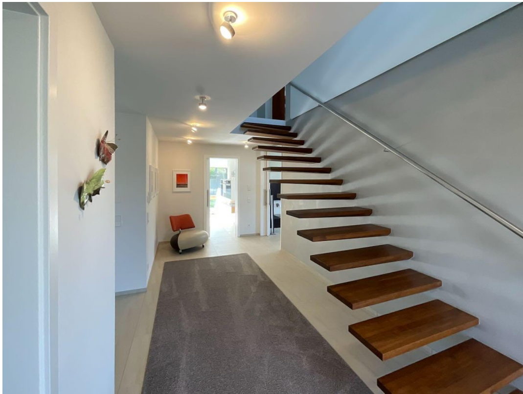
Hausflur mit Kragarmtreppe