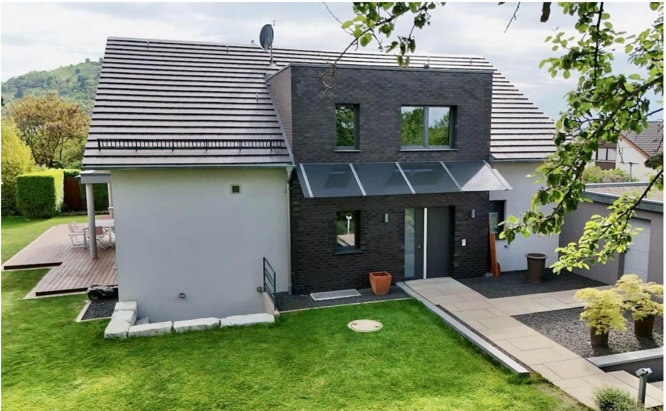
Haupteingang auf der Ostseite