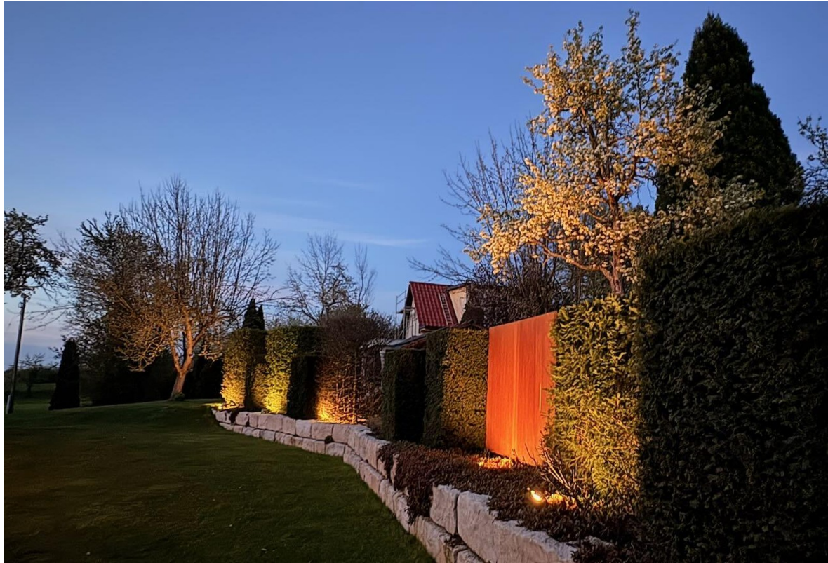
Garten am Abend