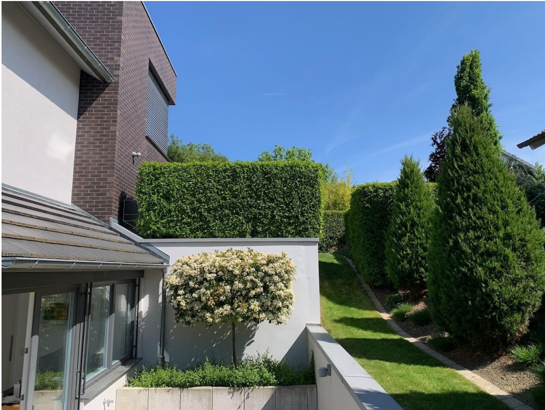
Terrasse der ELW