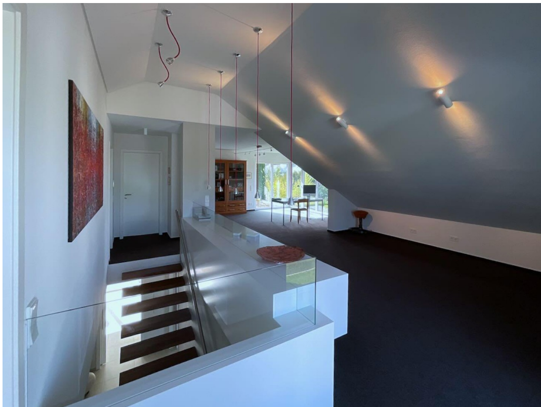
Galerie 1. OG