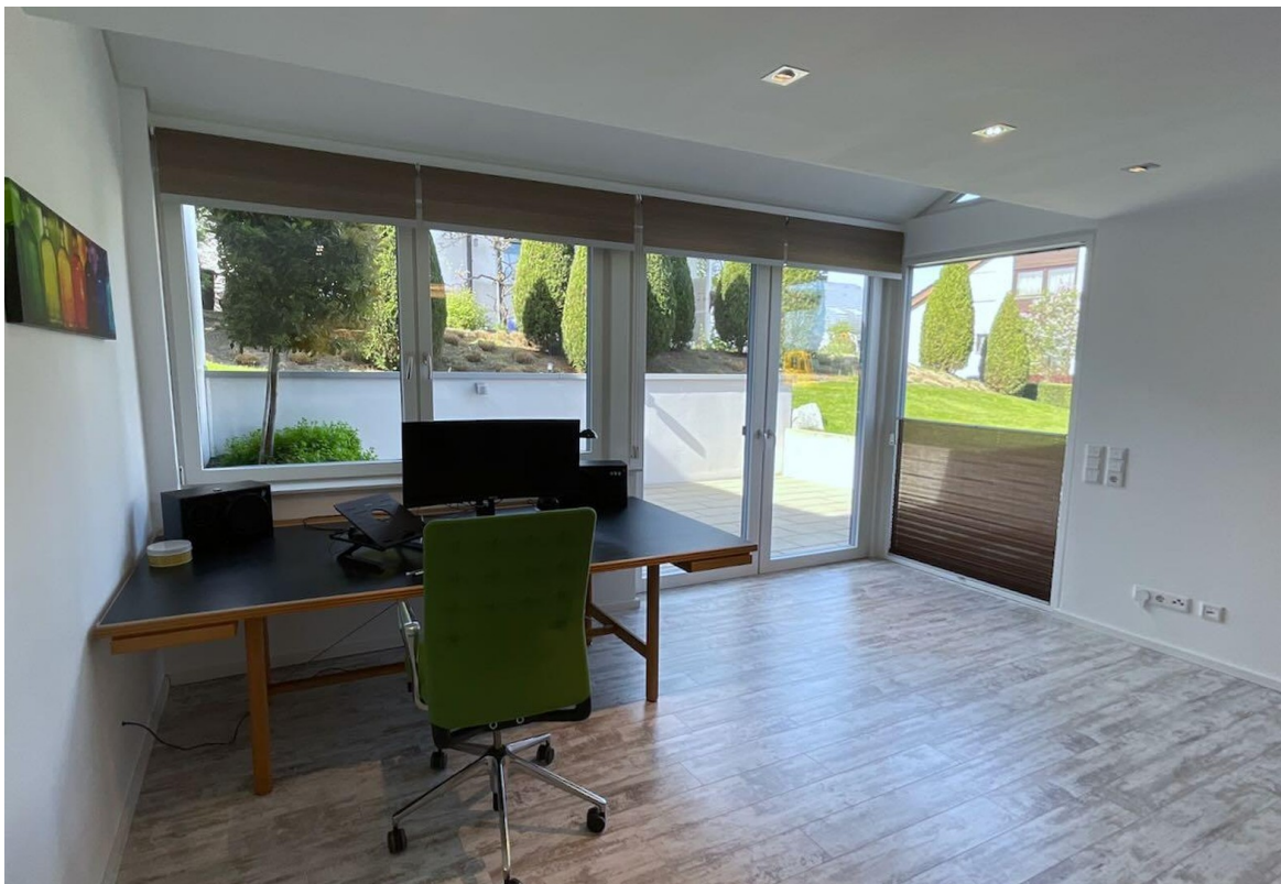
Home-Office in der ELW