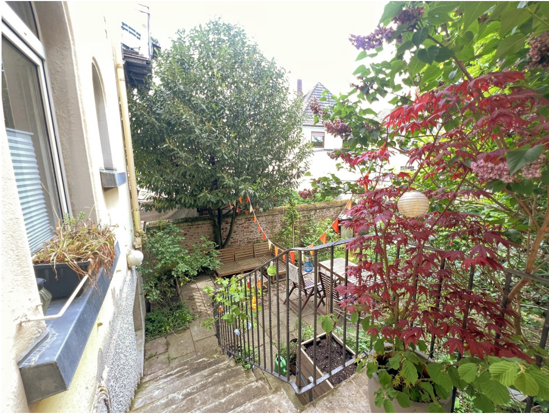
Zugang zum Garten