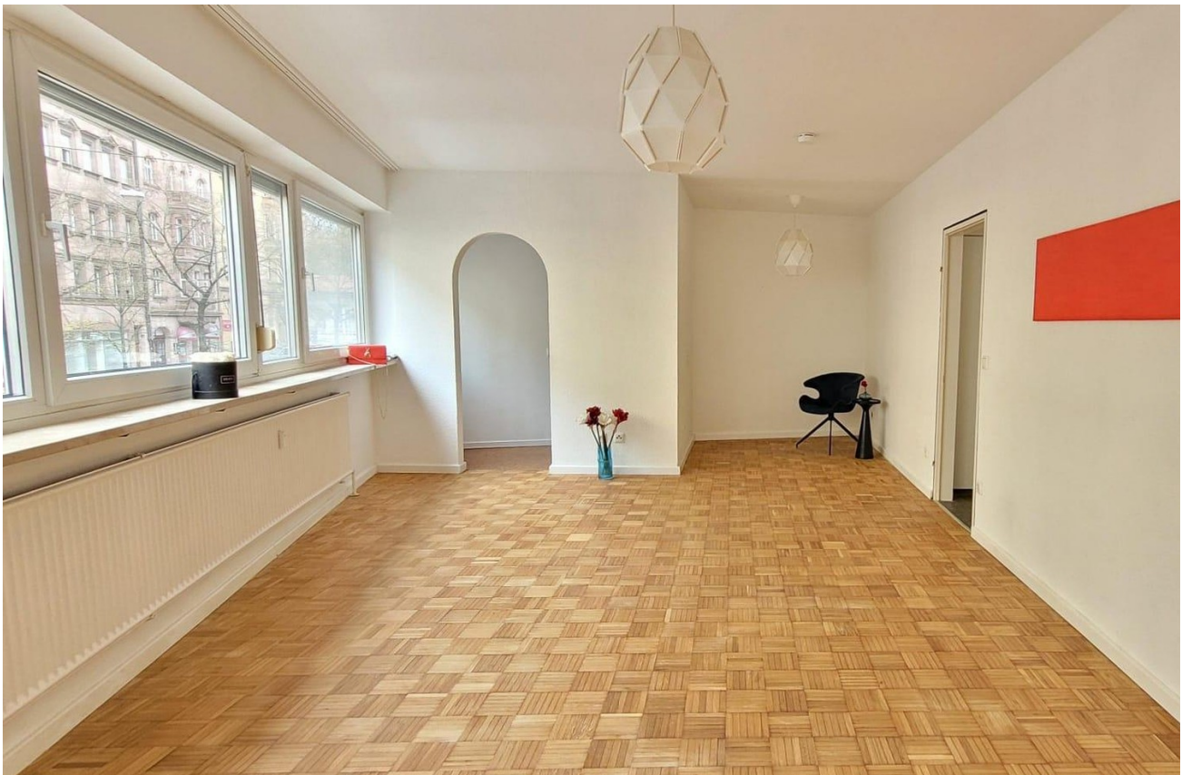
Schlafnische oder Essbereich