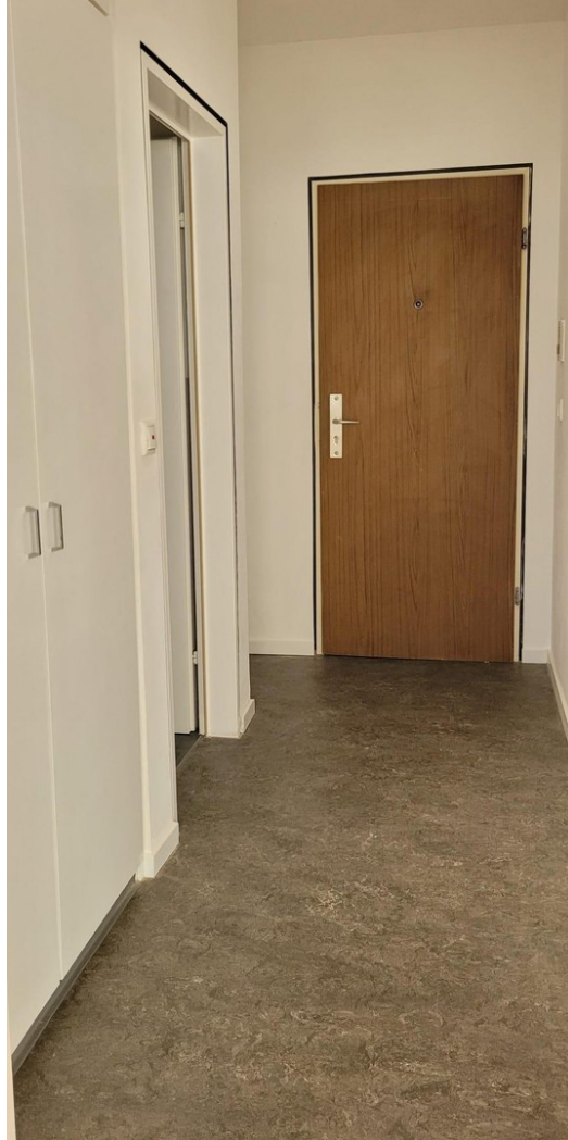
Flur mit Einbauschränk