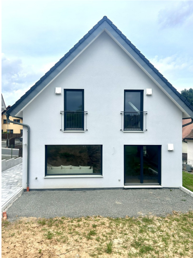
Südseite zum Garten