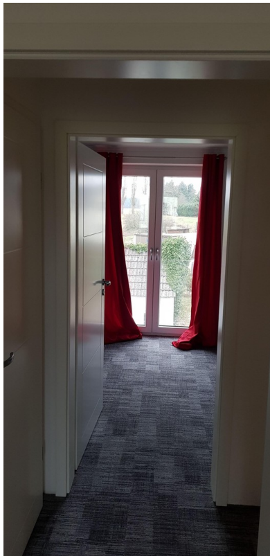
Schlafzimmer 2 (OG)