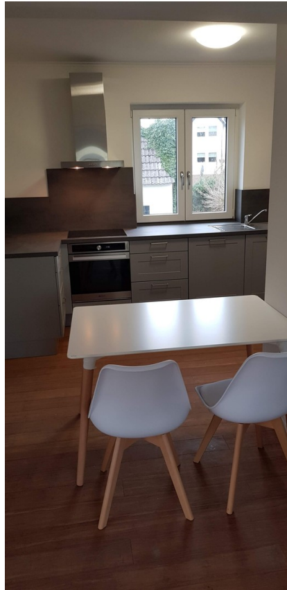
Essplatz und offene Küche