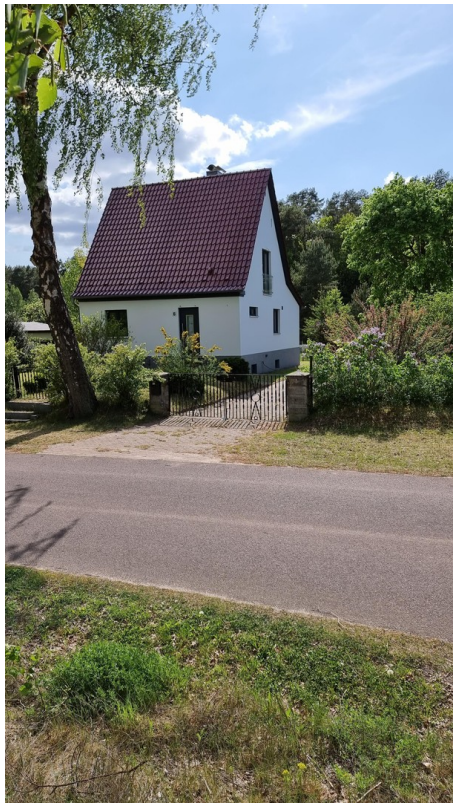
Blick von der Straße