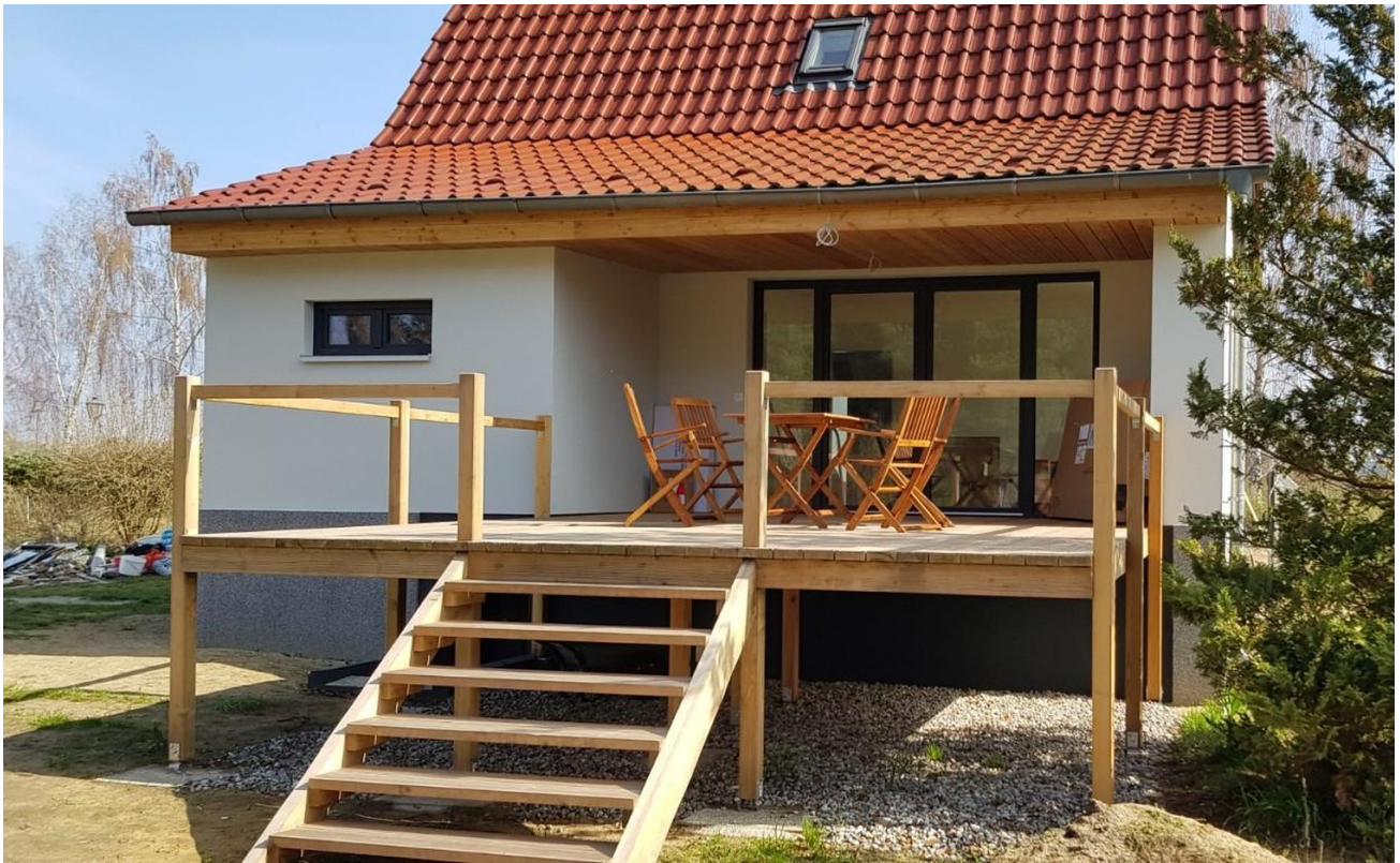
Blick aus dem Garten