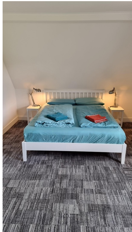
SZ 1 (OG)