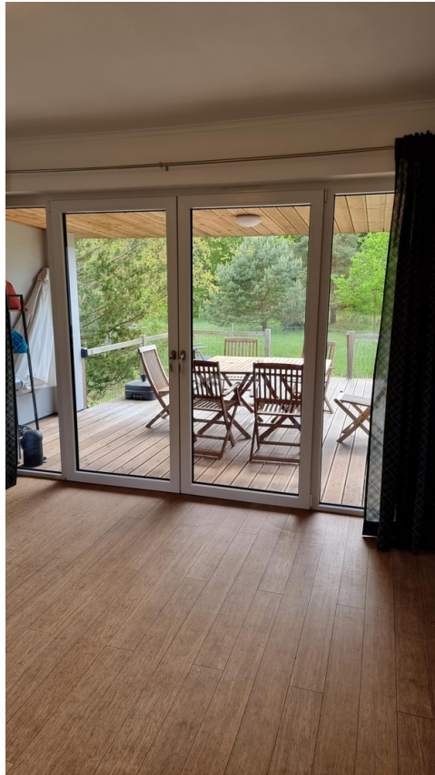
Blick aus dem WZ