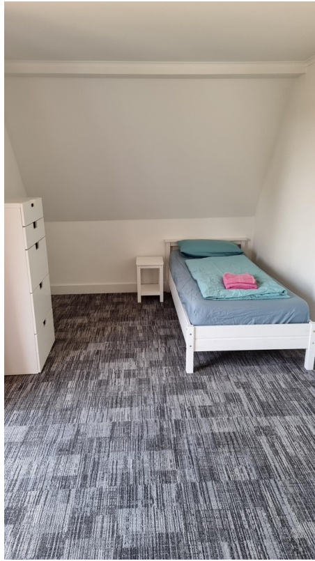
SZ 2 (OG)