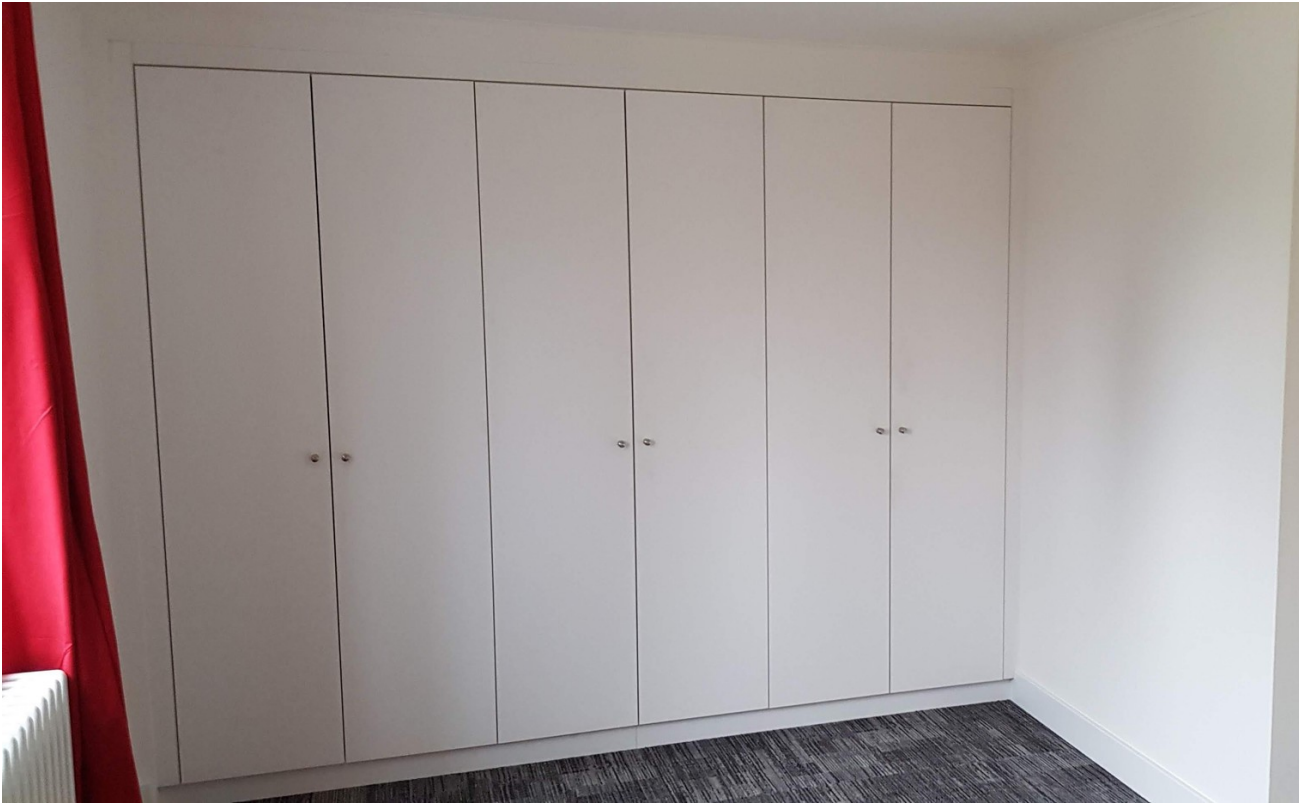
Wandschrank (Schlafzimmer 1)