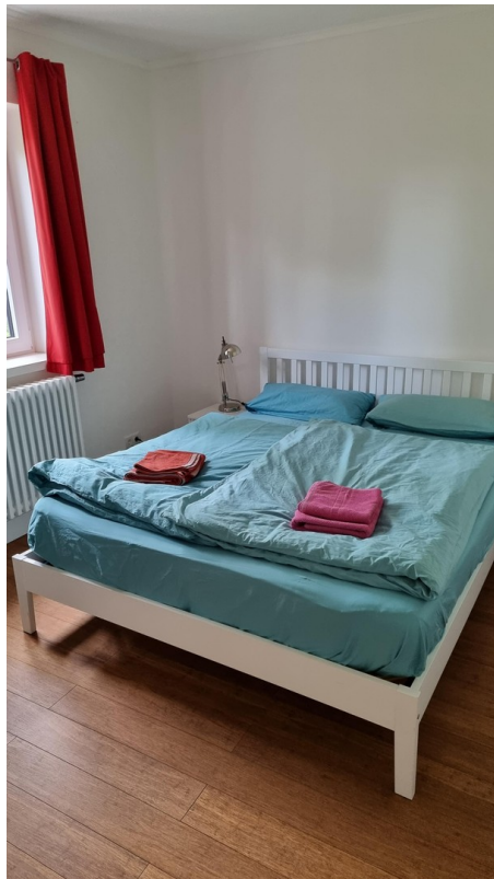
SZ 3 (EG)