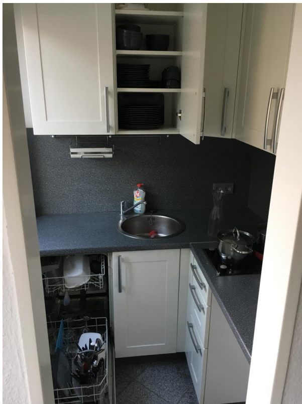
Einbauküche mit Waschmaschine