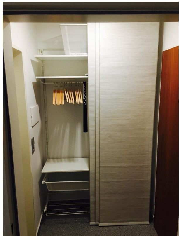
Garderobe im Flur