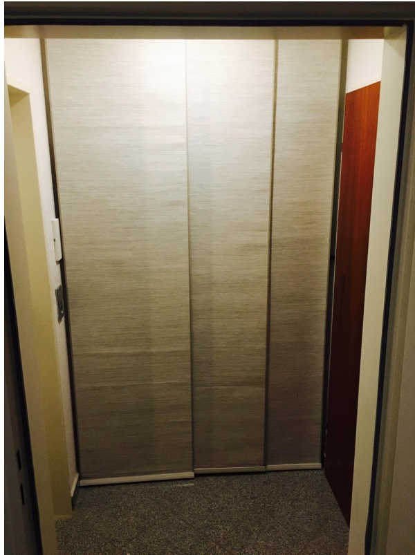
Garderobe im Flur