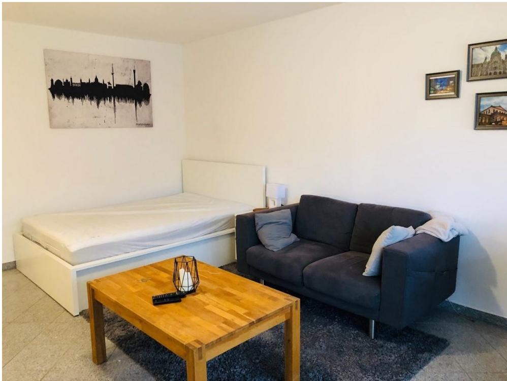
Wohn- & Schlafbereich