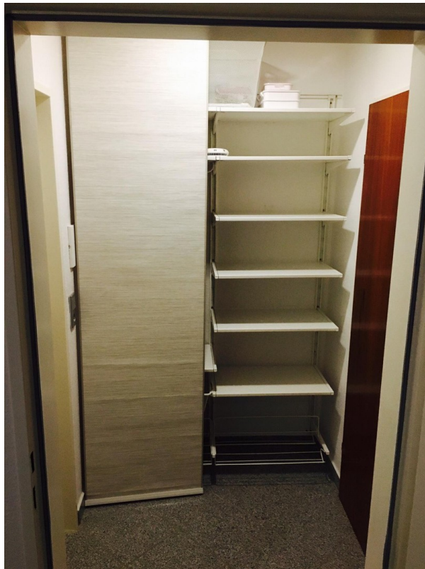
Garderobe im Flur