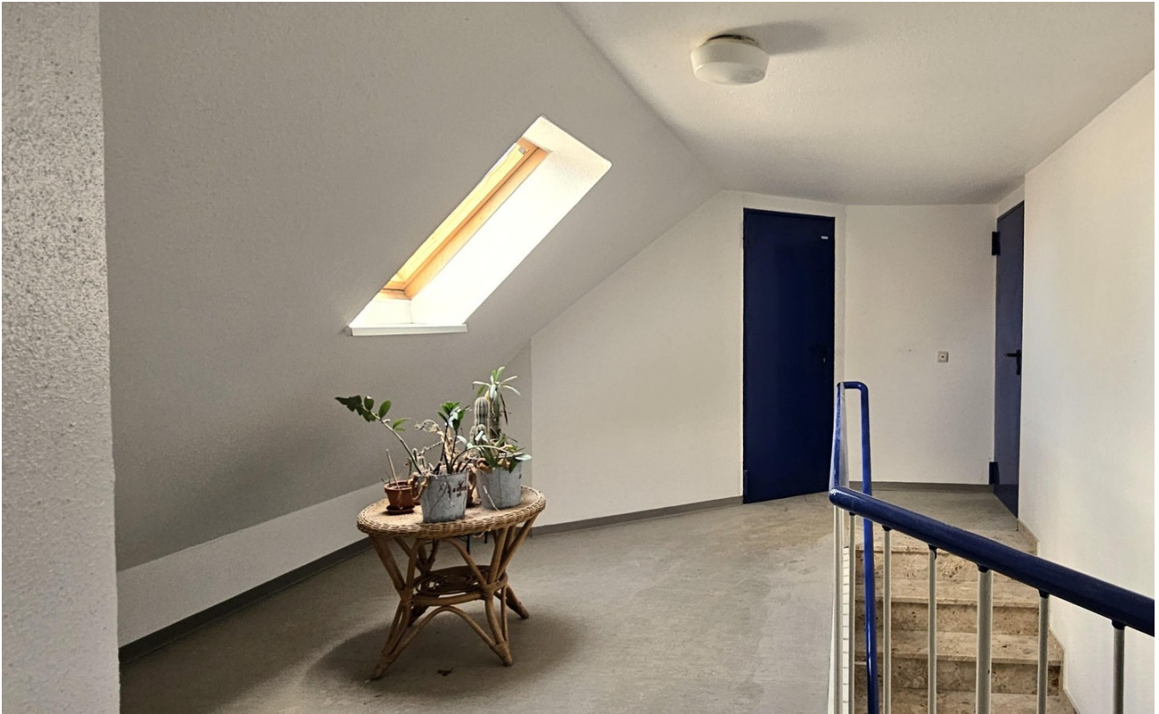
Zu den Abstellräumen