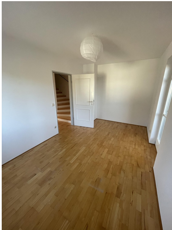
1. Stock - Zimmer 1