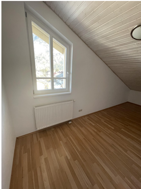
2. Stock - Zimmer 2