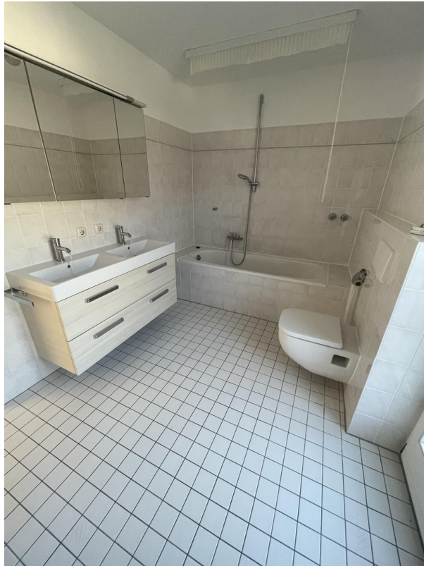
1. Stock - Bad