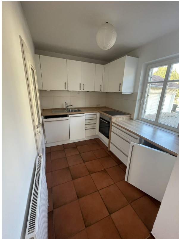
EG - Küche