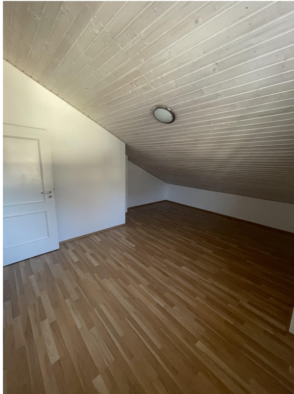
2. Stock - Zimmer 1