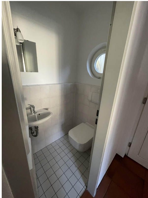
EG - Gäste - WC