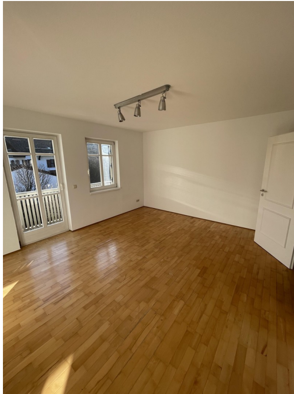
1. Stock - Zimmer 2