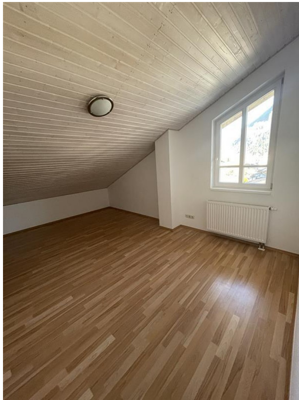
2. Stock - Zimmer 1