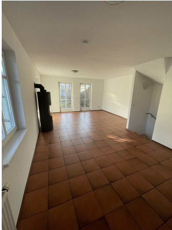
EG - Wohnzimmer mit Ofen