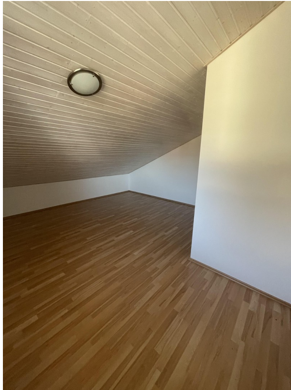
2. Stock - Zimmer 2