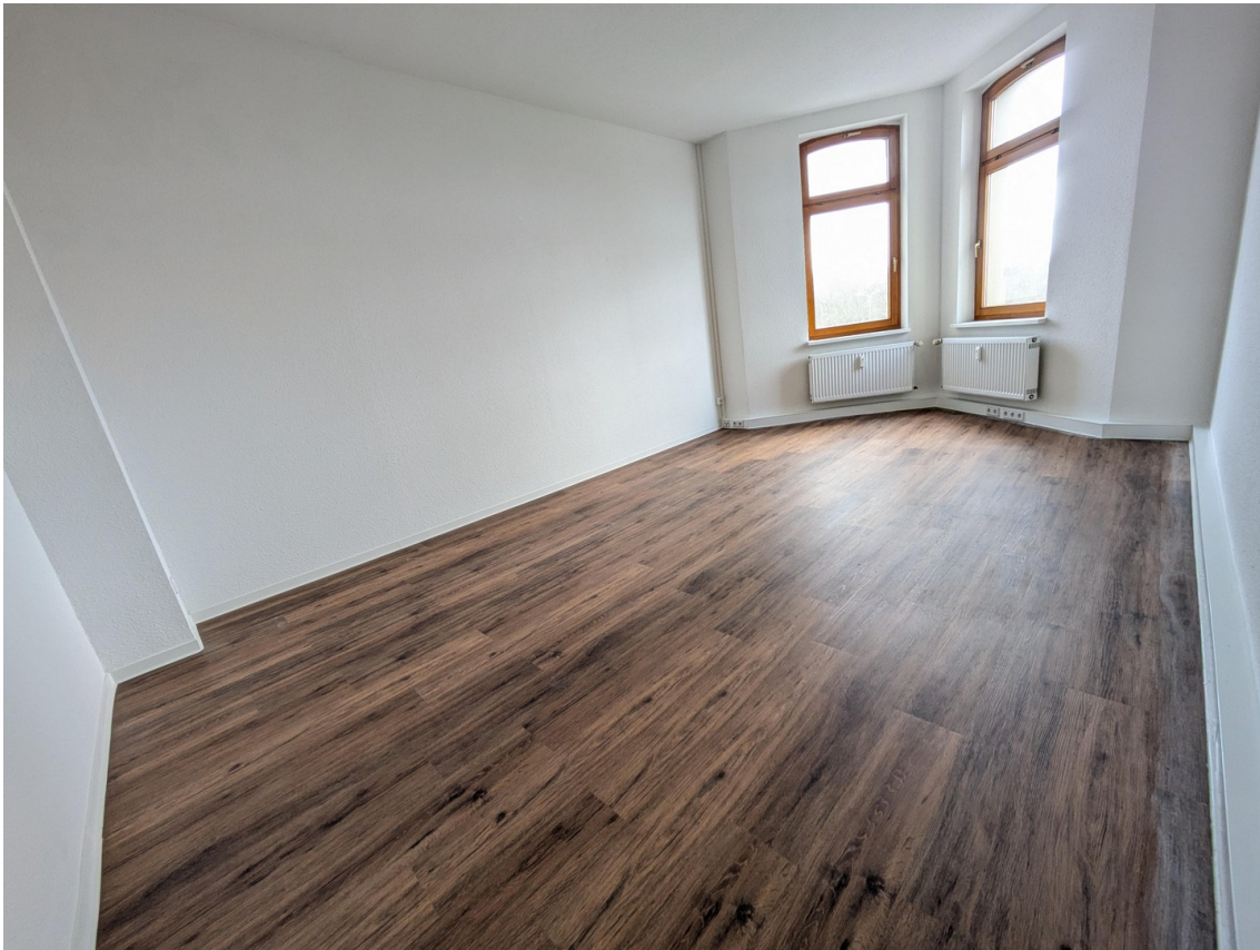
großes Zimmer mit Erker