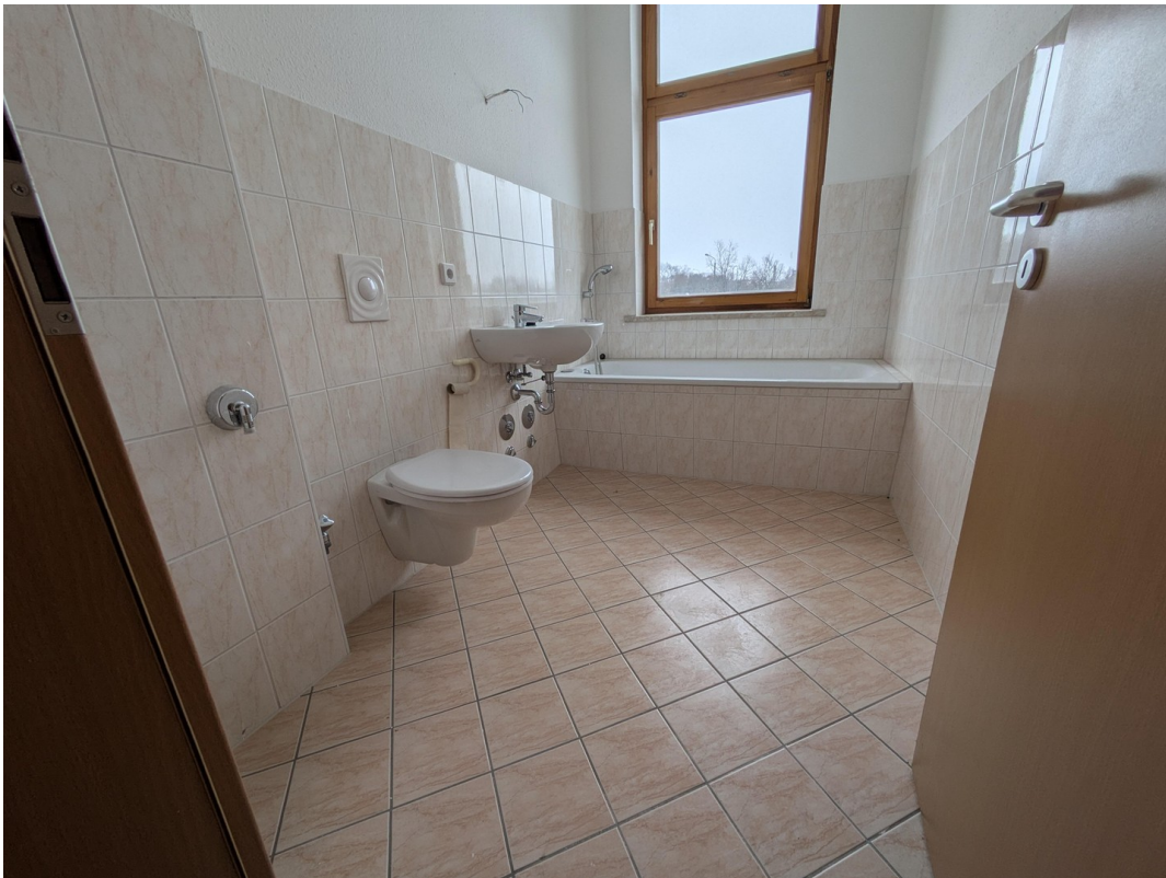
Bad mit Fenster und Badewanne