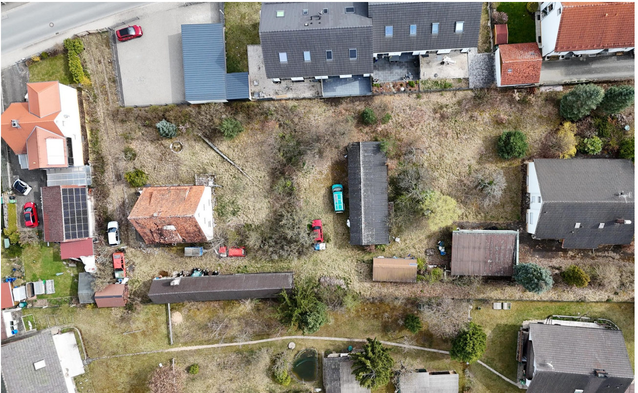
Wernsbacher Str. / Am Löhle 7