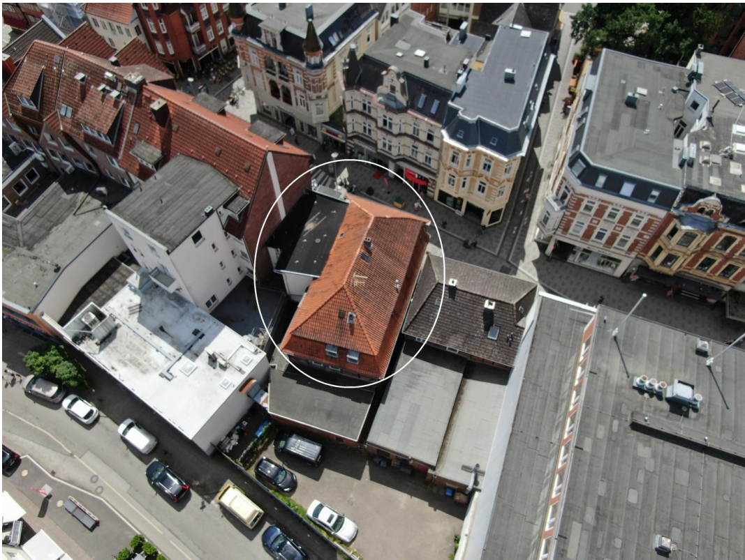
Luftbild mit Markierung 2