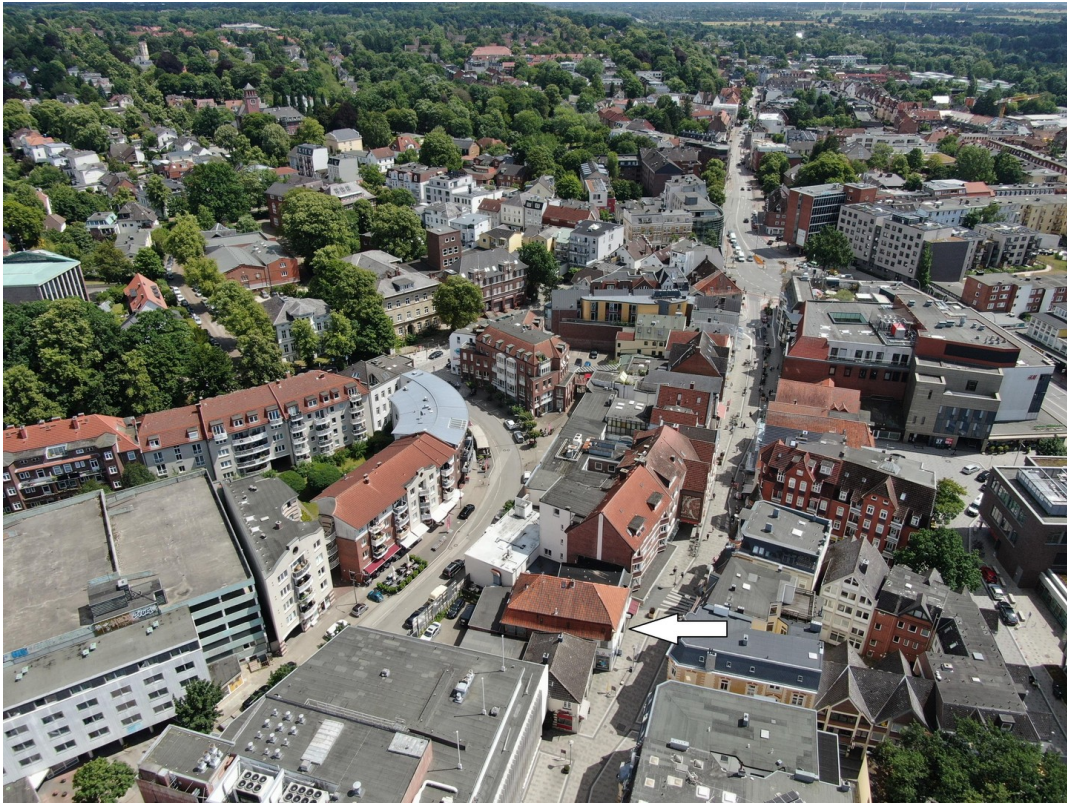
Luftbild mit Markierung 1