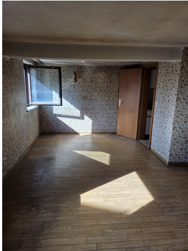
Wohnzimmer mit Tür zur Küche