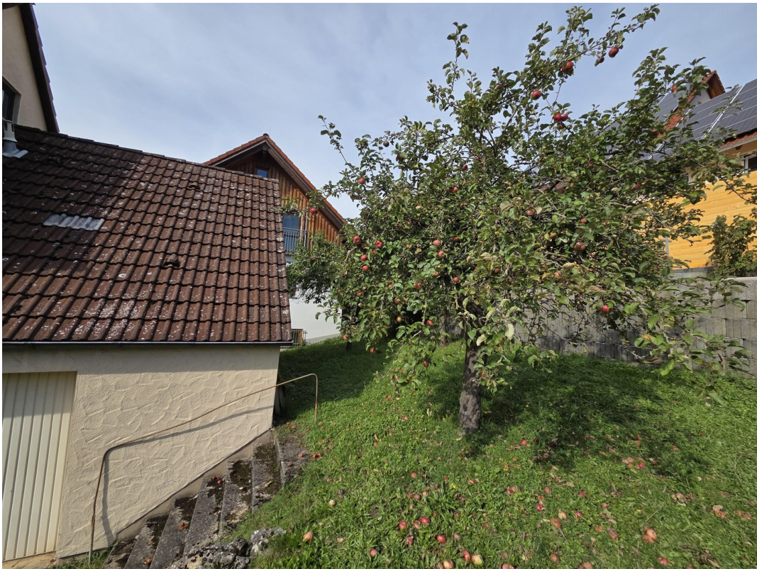
Garten mit Obstbäumen