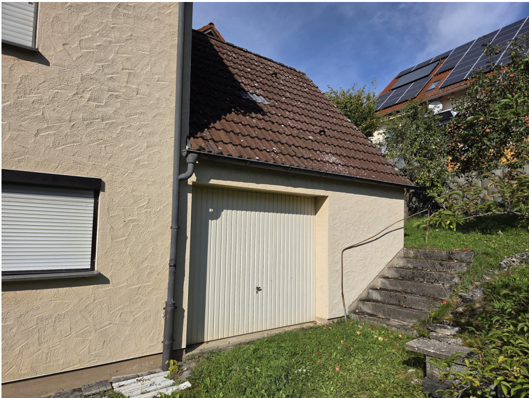
Ansicht Garage außen