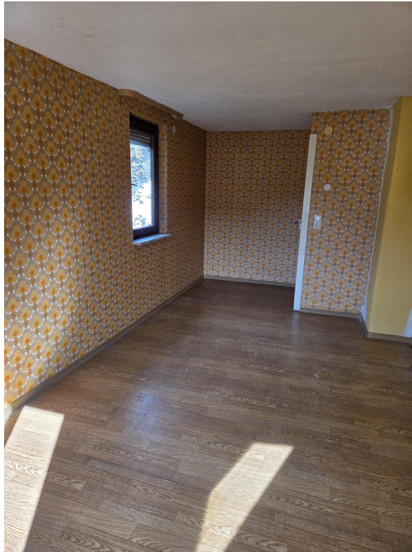
Kinderzimmer Blick zur Tür