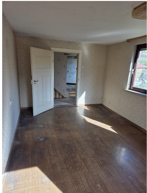
Elternschlafzimmer Blick zur T