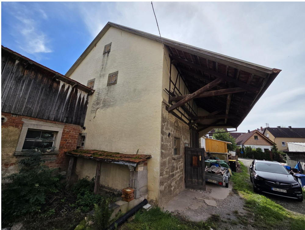
Stall/Scheune von außen