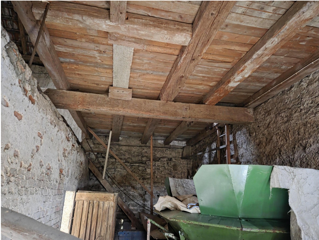
Scheune mit Zugang OG