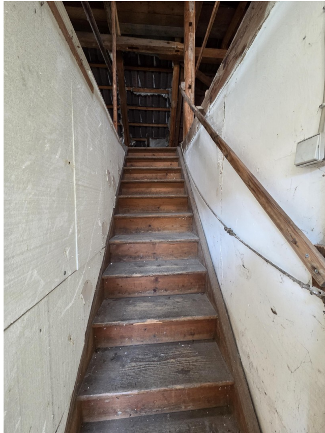
Zugang DG Treppe