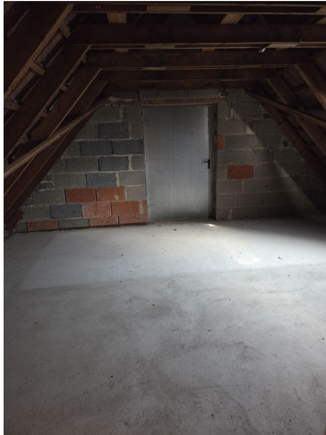
Dachboden über Garage