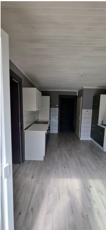
Küche Richtung Flur