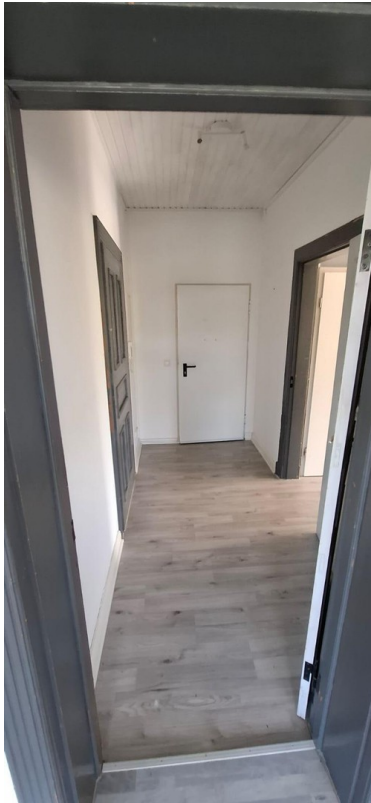
Flur Richtung Eingang