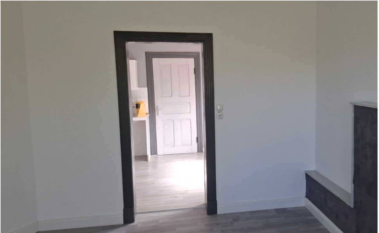
Zimmer 3 Richtung Küche