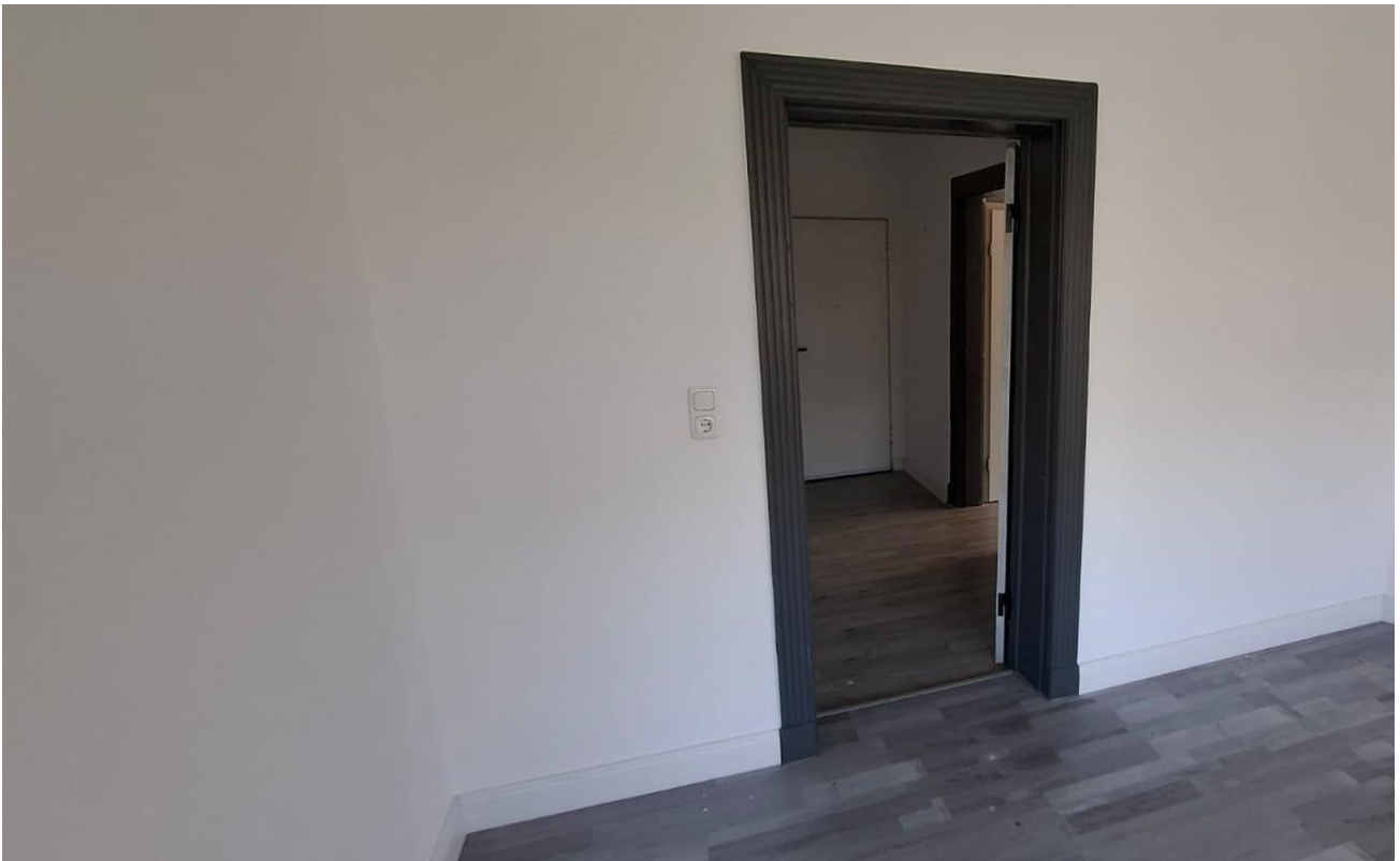
Zimmer 1 Richtung Flur