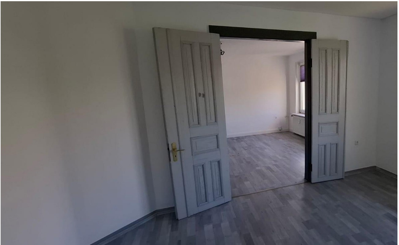
Blick von Zimmer 2 in Zimmer 1