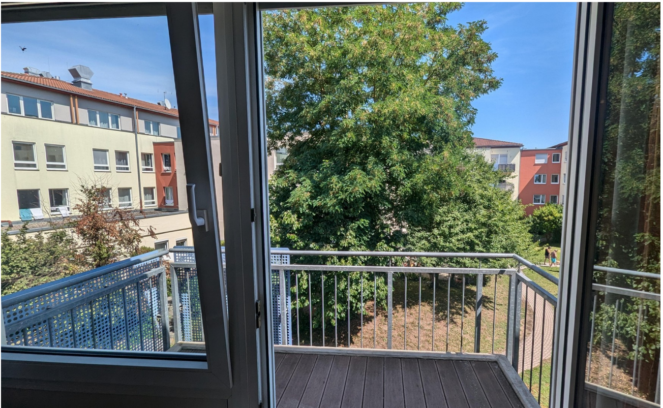
Blick zum Balkon