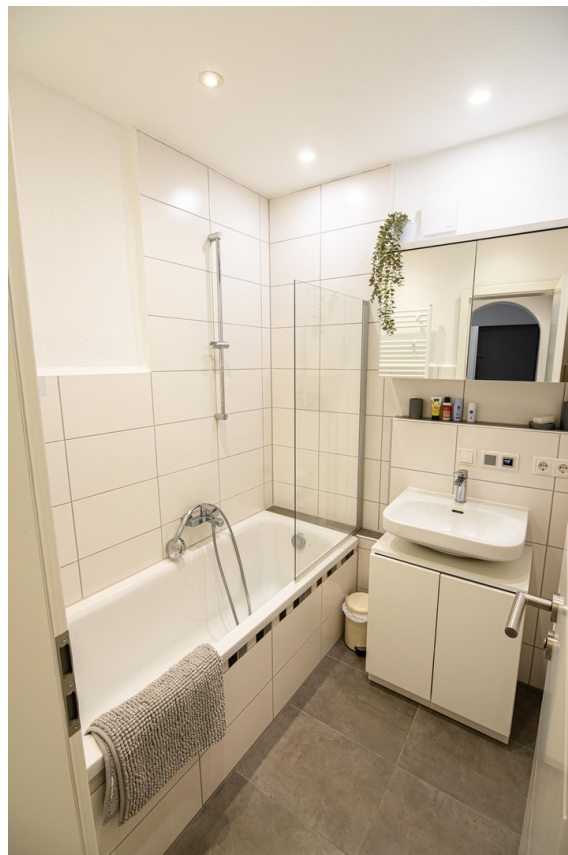
Badezimmer (Bild 1)