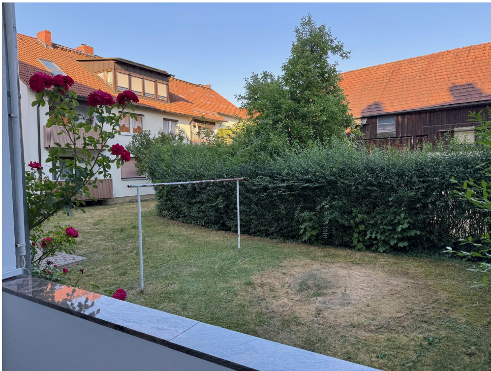
Ausblick Balkon (Bild 3)