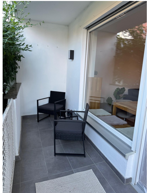
Balkon (Bild 1)