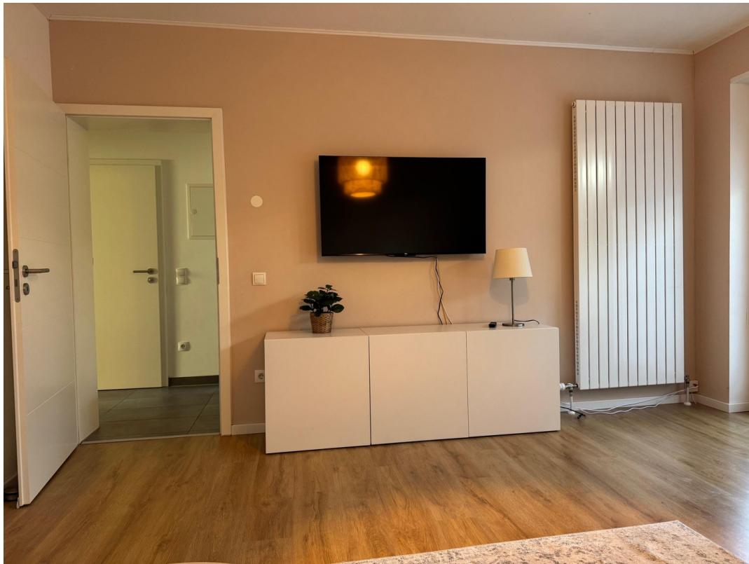
Zimmer (Bild 2)