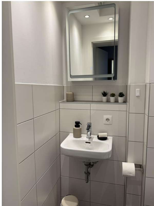
WC (Bild 1)