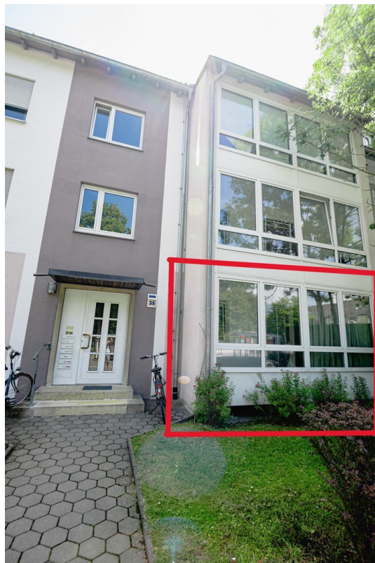
Ansicht Haus (Strassenseite)