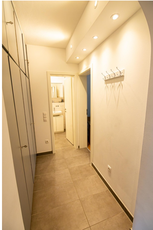
Flur (Bild 5)