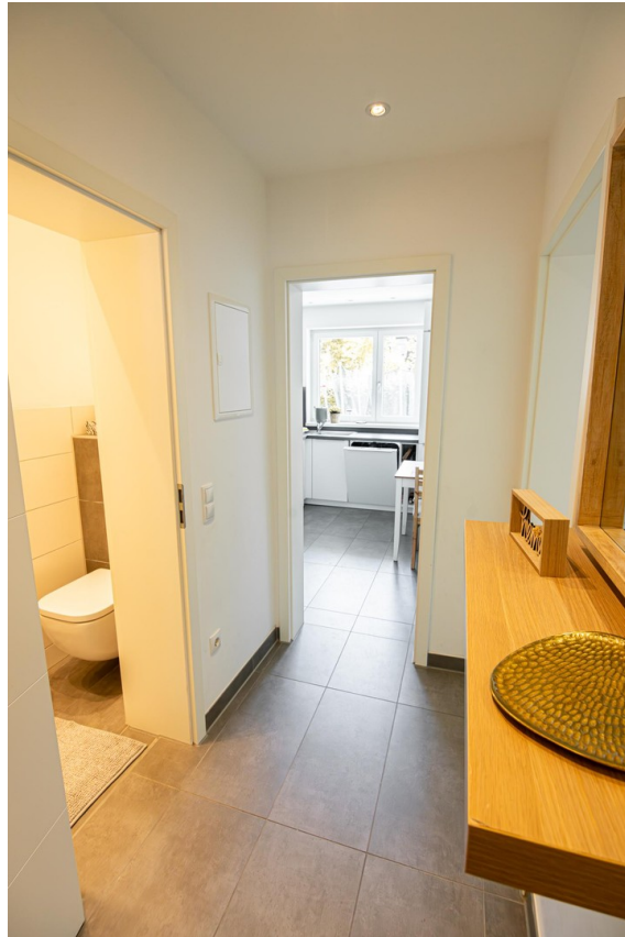
Flur (Bild 3)