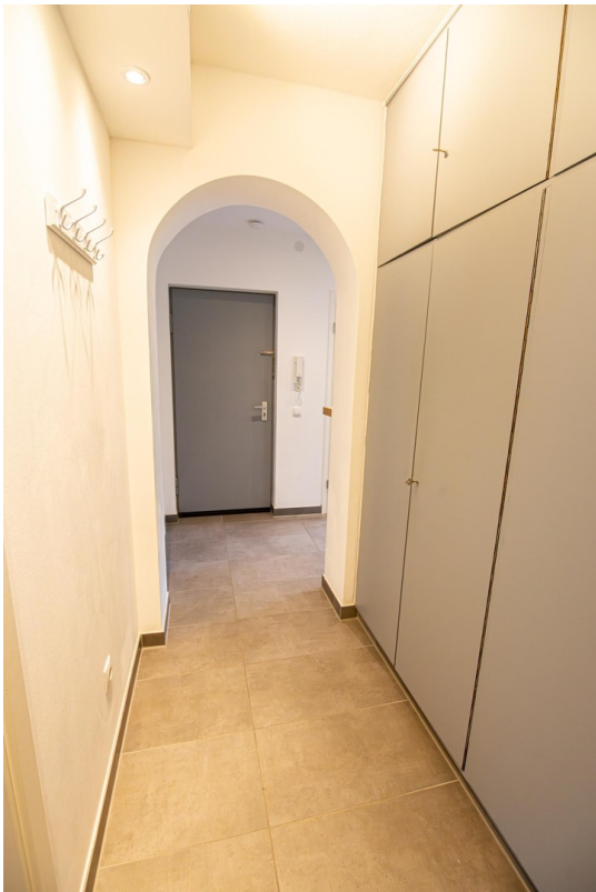
Flur (Bild 1)