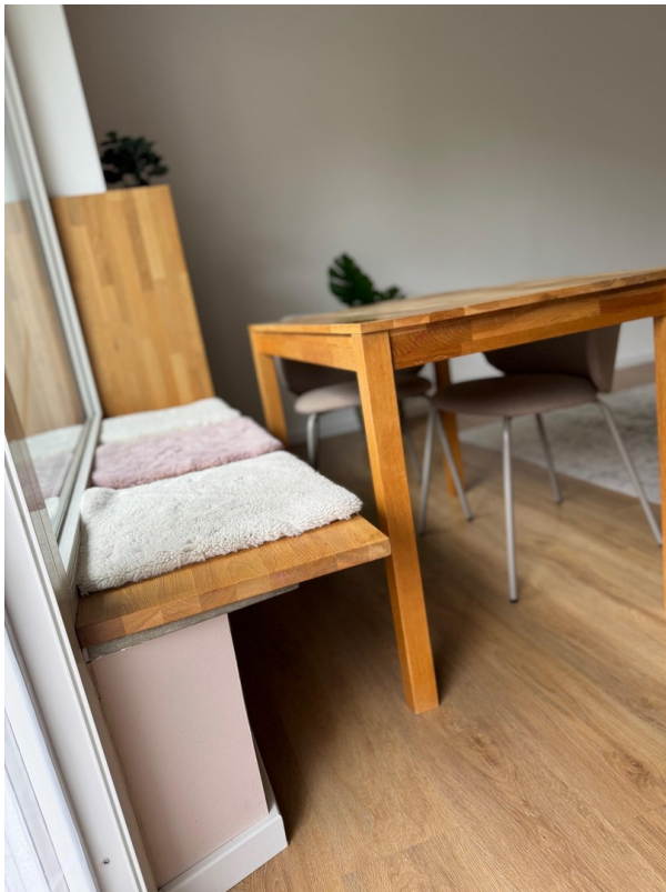
Zimmer (Bild 3)