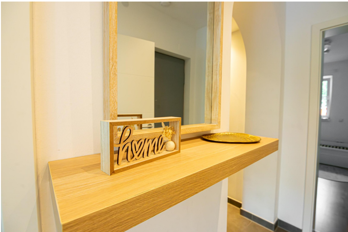
Flur (Bild 4)