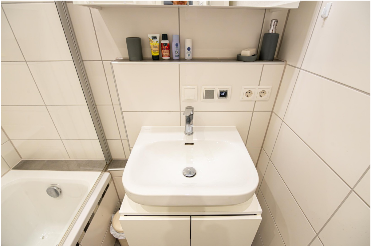
Badezimmer (Bild 2)