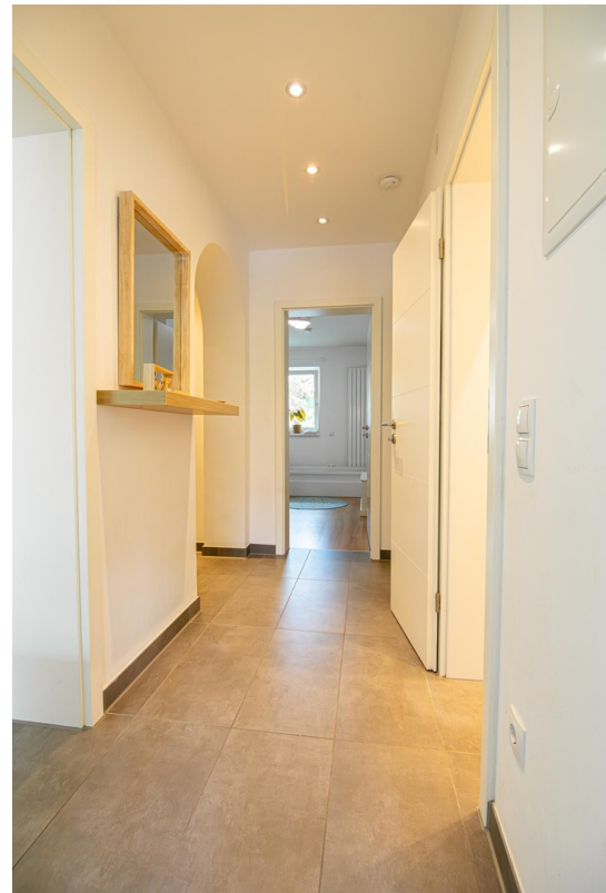
Flur (Bild 2)