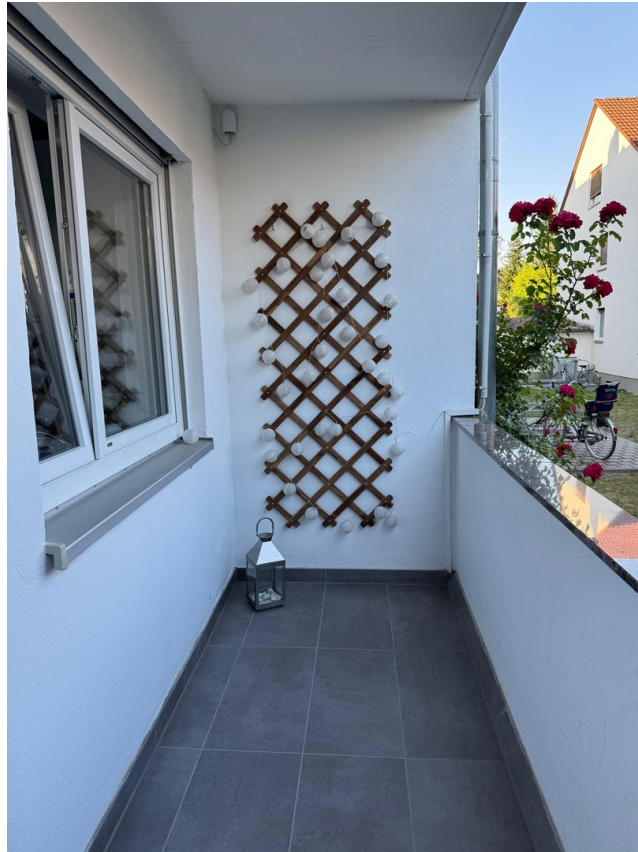
Balkon (Bild 2)