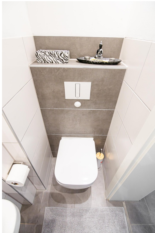
WC (Bild 2)